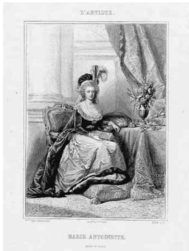
Figure 2. Victor Florence Pollet, Portrait de Marie-Antoinette d'après Élisabeth Vigée-Lebrun, Finot & Bougeard (imprimeurs), Charles Paul Furnes (éditeur), gravure à l'eau forte, 27 x 20 cm, Paris, entre 1830 et 1880 © British Museum.

La reproduction de tableaux étant particulièrement propice à la cristallisation de telles interrogations, cette question, qui semblait être résolue dès l'apparition du daguerréotype 42 , s'est imposée dans le cadre des débats ayant placé en concurrence la gravure et la photographie pour la reproduction d'œuvres picturales 43 (fig. 2). Bien que les amateurs aient encore été sensibles à la faculté que l'on prêtait à la gravure de rendre compte de la couleur, son caractère graphique semblait la destiner davantage que la photographie à la reproduction du dessin 44 et donc de la gravure elle-même. Les discours entourant la concurrence entre graveurs et photographes abordaient des questions d'autant plus épineuses que les enjeux n'étaient pas seulement artistiques, mais aussi financiers. Comme le suggère l'ambiguïté lexicale, le problème de la reproduction du réel se mêlait à celui de la reproduction