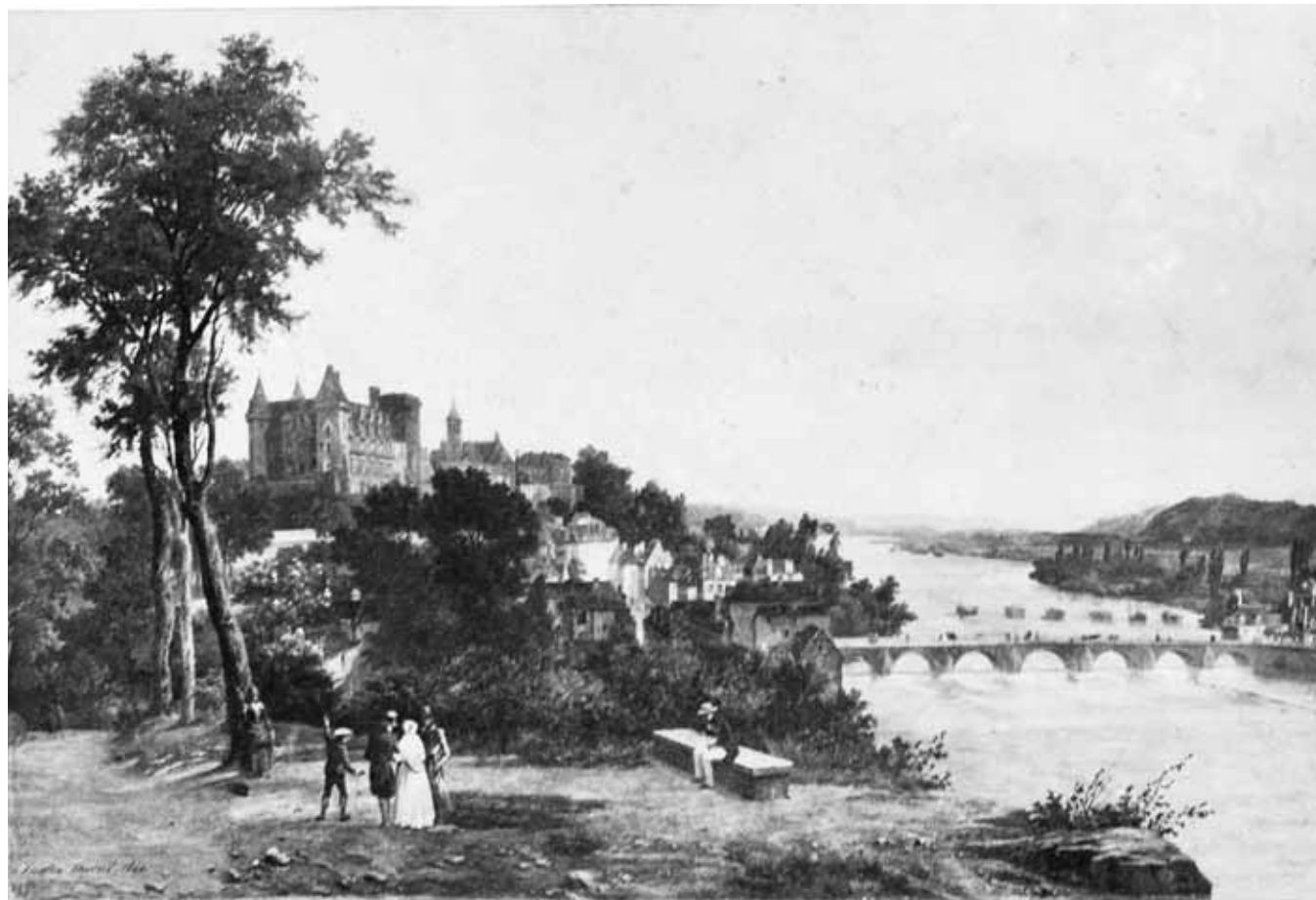
Figure 1. Édouard Baldus, Sans titre , épreuve sur papier salé, 22 x 33 cm, Paris, entre 1850 et 1859 © J. Paul Getty Museum.

L'affinité entre le travail de la matière picturale et celui de la matière photographique pénètre aussi les descriptions d'atelier. Peintres et photographes doivent lutter contre l'odeur des produits chimiques qui indispose les visiteurs et doivent se prémunir des taches en suivant les conseils dispensés par La Lumière , qui pousse l'analogie jusque dans le cabinet de toilette : « En résumé, étant données des mains chargées de produits photographiques aussi riches en tons et couleurs que la palette de Delacroix et de Diaz, on pourra toujours les rendre plus blanches et nettes en procédant de la manière suivante 18 [...] ». Cette comparaison sert d'introduction à une liste de recommandations numérotées impliquant l'usage d'acide hydrochlorique, de soude ou encore de cyanure de potassium, autant d'indices rappelant que l'auteur s'adresse à des spécialistes. De plus, l'analogie avec la peinture fondée sur la création des couleurs, les mélanges savants de pigments et de produits chimiques renvoie d'autant plus à une pratique traditionnelle que les peintres des