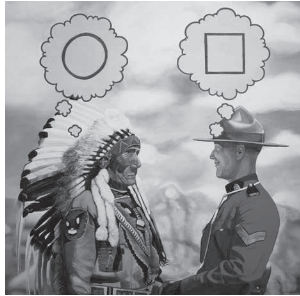
Figure 1. David Garneau, Not To Confuse Politeness With Agreement , 2013, huile sur toile, 122 × 122 cm. Photo: David Garneau.

Liée au pouvoir, la langue transmet les manières de voir et de faire, les perspectives du monde, l'esprit, le souffle même des peuples. En se voyant imposer les langues des cultures dominantes, les Autochtones du Canada ont été contraints de naviguer entre deux systèmes, deux cultures, sans arriver nécessairement à les maîtriser totalement. Si certains ont réussi à composer avec cette complexité, d'autres sont demeurés déstabilisés, voire défaits. Bien que de nombreuses communautés parlent toujours la langue ancestrale, cette continuité s'est réalisée au prix