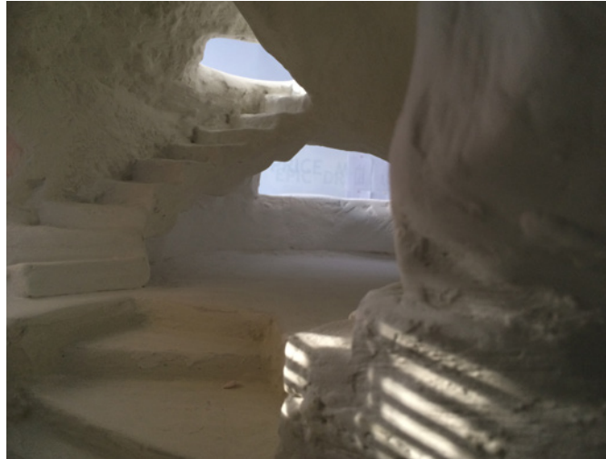
Figure 3. Tour , 2018, maquette (à l'échelle 1:20) et dessins (1:40, 1:50), plâtre, polystyrène, bois et impression jet d'encre, Outsider (détail), Montréal.

une des premières pistes chronologiques entre la «haute culture» et les pratiques qui se développent hors de toute culture. Jean-Clarence Lambert écrit au sujet du refus de l'autorité en art qu'il est un «anticulturalisme» qui prépare celui de Cobra, comme il rejoint celui de Dubuffet. 14 Lambert relève une étape importante dans la formation de Cobra, lorsqu'en 1945, le manifeste du Nouveau Réalisme est adressé au MoMA de New York notamment signé par Asger Jorn. Jorn s'écarte de l'«art brut qui l'intéresse, en ce qu'il s'approprie des formes diverses et dévalorisées pour les transmuter». 15 Il a vu la nécessité de construire des maisons fascinantes dans lesquelles «le rôle unique de l'architecture est de servir les passions humaines». 16 La maison devait être «une machine visant à choquer, à fasciner, une machine relevant l'humain et l'expression universelle. C'est la nouvelle architecture». 17 À ce propos, Jorn a écrit à l'artiste peintre nucléariste 18 italien Enrico Baj