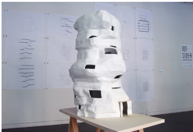
Figure 4. Tour , 2018, maquette (à l'échelle 1:20) et dessins (1:40, 1:50), plâtre, polystyrène, bois et impression jet d'encre, Outsider (détail), Montréal.

qu'une «[...] maison n'est pas une machine à habiter, mais une machine à surprise et à impressionner». 19