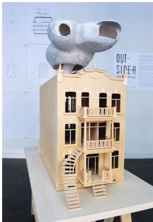
Figure 2. Bulles , 2018, maquette (à l'échelle 1:20) et dessins (1:40), bois, plâtre et impression jet d'encre, Outsider (détail), Montréal.

5. Pierre-André Normandin, «Le Plateau veut limiter les mezzanines en toiture», La presse , 6 février 2019, https://www.lapresse.ca/actualites/grand-montreal/201902/06/01-5213708-le-plateau-veut-limiter-les-mezzanines-en-toiture.php (2 août 2019).