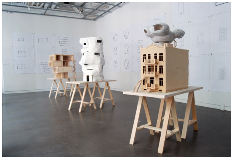
Figure 1. Outsider (vue d'installation), exposition solo présentée à la Maison de l'architecture du Québec du 21 juin 2018 au 30 septembre 2018, Montréal.

des arts à l'architecture, ces projets représentent une recherche sur l'architecture en tant qu'œuvre d'art. La dynamique des volumes et l'ensemble des plans, des coupes et des axonométries qu'ils présentent répondent à une prédilection pour l'amalgame. Chaque prototype est une version du rêve d'habiter qui puise dans les images matérielles (Gaston Bachelard) comme dans les «proto-images» (Jean Dubuffet) que sont la coquille, le cocon, le nid, le terrier. Ces projets reprennent la notion d'«image latente» en architecture, décrite par Bachelard lorsqu'il interroge les rapports entre imaginaire et rationalité. 3 Bachelard reprend les théories jungiennes de l'archétype et du symbole pour s'intéresser, dans La poétique de l'espace (1957), aux images poétiques de la maison. 4 Ces images poétiques sont les images latentes qui illustrent, sous leurs formes élémentaires, la fonction d'habiter. C'est le cas, par exemple de la spirale, de la grotte et de la coquille.