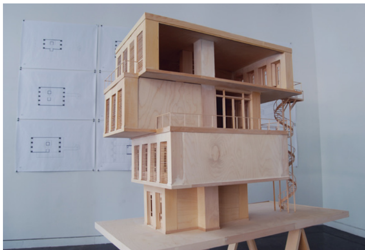
Figure 6. Blocs , 2018, maquette (à l'échelle 1:20) et dessins (1:40), bois et impression jet d'encre sur papier, Outsider (détail), Montréal.

Selon Bachelard, «habiter» relève de l'image du repos, autant que d'un rêve de tranquillité. Le prototype est la construction d'un espace de solitude qui «avale» l'occupant dans un monde fantastique, dévoilant l'imaginaire de chacun. L'image du mollusque avec sa coquille est liée par analogie à un microcosme transposé par une image d'animalité. C'est paradoxalement que l'image de la tour elle-même projette l'importance de la verticalité de la maison dont traite Bachelard lorsqu'il évoque la distribution des espaces domestiques entre la cave et le grenier: «La maison est imaginée comme un être vertical. [...] Elle est un des appels à notre conscience de verticalité». 23 Une maison sans cave ni grenier est pour Bachelard un lieu qui exclut l'irrationnel de l'architecture. Dans La poétique de l'espace , les images premières de la cave et du grenier, du feu et de l'eau, du nid et de la coquille, éveillent un sentiment de sécurité qui protège au-delà des matériaux et renforcent