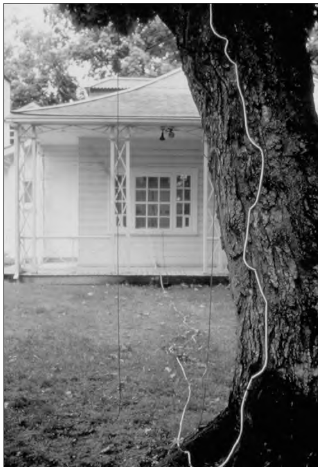
« Prière », 2000. Des colliers de prière coulent de la cime d'un grand érable

L'arbre, exploité de manière spectaculaire dans « L'arbre sacré », revient tout en assurance, en recueillement et en sagesse dans « Prière », lors de l'événement Artboretum tenu à la Maison Hamel-Bruneau pendant la Biennale d'art actuel en 2000. Dans « L'arbre sacré », le cèdre qui perfore la paroi entre deux espaces semble moins vouloir réunir deux lieux que croître entre les deux : d'un côté du mur, en effet, les racines arrachées flottent au-dessus du sol tandis que de l'autre, le tronc et la cime se redressent immédiatement le long de la cloison et tendent vers le haut, comme si l'arbre prenait appui sur cette frontière, sur ce déséquilibre, pour mieux prendre son envol entre deux mondes en quête d'un univers unique qui lui serait propre. Transgressant au contraire les frontières pour mieux sceller leur abolition, « Prière » a clairement dessein de fusionner l'intérieur et l'extérieur des choses et des êtres, et de montrer la possible convergence de regards nés de points de vue différents sur le monde. Partant de la blessure d'un grand érable croissant sur le parterre, Robertson laisse couler sur son écorce six colliers de prière composés au total de quelque 40 000 perles enfilées une à une et marquées chacune d'une lettre d'un poème africain glorifiant l'arbre. Leurs six couleurs signifient les quatre directions (jaune Est, noir Ouest, blanc Nord et rouge Sud)