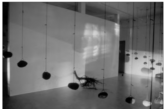
« L'arbre sacré », 1995. Dans la salle 2, les racines du cèdre sont entourées par le cercle féminin des pierres suspendues entre ciel et terre