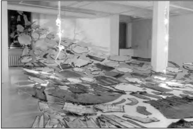
« Dialogue entre Elle et moi à propos de L'esprit des animaux », 2002. Une volée de peaux qui glissent vers l'ouest évoquent aussi un banc d'animaux marins.

1991 à l'aide de la théorie de Fernande Saint-Martin (1987). L'investigation d'une œuvre par analyse syntaxique nous renseigne sur la manière dont l'artiste perçoit la réalité et négocie les tensions de sa vie psychique en s'exprimant dans son œuvre. Nous sommes ici davantage sur le terrain de la culture que sur celui de l'ethnicité car l'étude des représentations autochtones et de la psychologie des sujets est aussi celle du processus de transformation de l'identité amérindienne.