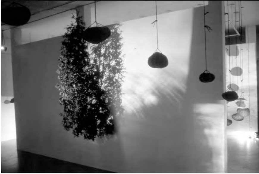
« L'arbre sacré », 1995. Dans la salle 1, la cime d'un cèdre représentant l'Esprit innu crève le mur de la salle tandis que ses racines se déploient dans la salle 2

hétérogènes qui le renvoient aux musées d'ethnologie. La hiérarchie et l'individualisation prennent alors forcément le pas sur le consensus et le collectif. Doit-on parler pour autant d'acculturation? Ou s'agit-il de réappropriation culturelle? À ce sujet, la démarche de Sonia Robertson est très informative. Cette artiste innue fait usage dans ses œuvres de codes et de stratégies dont il est difficile de trancher s'ils relèvent d'une tradition autochtone ou de l'esthétique contemporaine internationale. Elle se définit d'abord comme artiste. Pourtant, son travail est extrêmement connotatif et manifeste sans contredit la culture de ses ancêtres. Née en 1967 à Mashteuiatsh, cette créatrice multidisciplinaire s'intéresse à la musique, étudie la photographie et le cinéma, puis complète un baccalauréat interdisciplinaire en arts à l'Université du Québec à Chicoutimi en 1996. Son curriculum comporte plusieurs expositions individuelles d'œuvres avant tout installatives, éphémères. Elle participe à de nombreux collectifs et symposiums, surtout au Québec, mais aussi au Japon, en Haïti et en Allemagne.