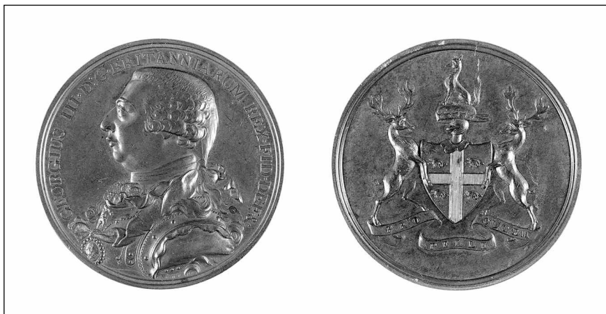
Figure 6 Avers et revers d'une médaille de la Hudson's Bay Company offerte aux chefs amérindiens loyaux après 1802 (Archives de la Hudson's Bay Company, Archives provinciales du Manitoba, N8086-N8087)

Les quelques lignes ici consacrées à l'importance des présents dans les relations entre Amérindiens et Européens démontrent, d'une part, que le commerce des fourrures, sans doute l'une des principales causes d'interactions entre les deux groupes en présence, n'échappait pas à la pratique des échanges et des distributions de cadeaux. D'autre part, elles révèlent que les « médailles de paix » ne constituaient qu'un des nombreux objets offerts aux Amérindiens, bien que certainement l'un des plus prestigieux, par les autorités coloniales et militaires, ainsi que par les intérêts commerciaux impliqués dans la traite des fourrures. Mais au-delà de ces considérations, ce survol a permis de mieux comprendre la nature et le contexte entourant l'octroi de ces médailles et de mettre en évidence certains indices qui tendent à étayer l'hypothèse retenue ici.