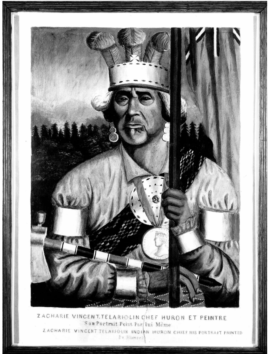
Figure 5 Autoportrait du chef huron Zacharie Vincent, vers le milieu du xix e siècle. Il porte au cou une large médaille à l'effigie de la reine Victoria (Musée du Château Ramezay, Montréal)

L'octroi de telles médailles s'est poursuivi jusqu'au xx e siècle où près de trois cents pièces ont été attribuées aux autochtones de l'Ouest par le gouvernement canadien lors de la signature des traités 1 à 11, entre 1871 et 1921 (Eyler 1979 : 55). D'argent, de bronze ou d'étain, les « médailles de paix » étaient