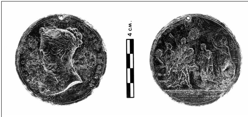
Figure 3 Avers et revers de la médaille à l'effigie de la reine Victoria mise au jour à Fort-Témiscamingue

Le séjour de cette médaille, pendant plus d'un siècle, dans le sous-sol de Fort-Témiscamingue a inévitablement laissé ses traces. Par conséquent, la présence de petites concrétions a contribué à une légère altération de sa surface. Toutefois, la principale modification subie par cette pièce consiste en une grosse perforation sise dans le haut de la médaille. Ulérieure à sa fabrication, cette perforation a entraîné la disparition d'une infime partie de l'inscription de l'avers, le sommet du E de « DEI », et de l'iconographie du revers, plus précisément le côté gauche des armoiries de la Cité de Londres (fig. 3). Une telle modification revêt ici une importance particulière puisqu'elle semble indiquer un changement de fonction, voire de vocation, ou tout au moins une nouvelle façon d'exhiber l'objet en question.