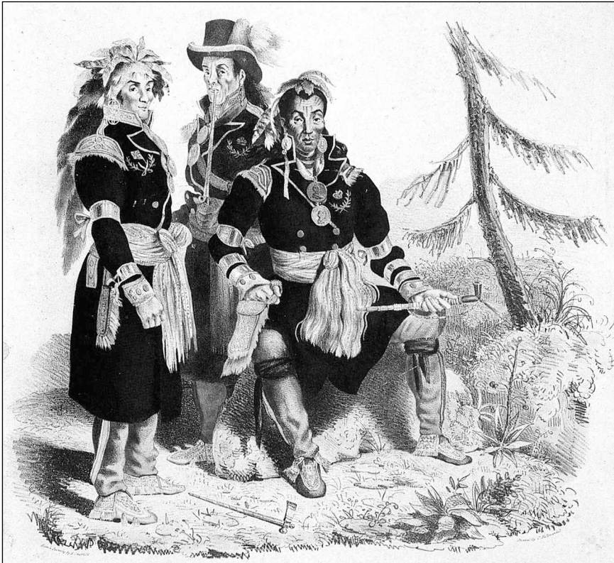
Figure 4 Chefs hurons arborant des médailles, vers 1825. Peinture de Edward Chatfield

échappe désormais aux Amérindiens. Toutefois, elle persistera sous forme de cérémonies de remise de cadeaux, en certaines occasions officielles, et surtout en contexte commercial où la traite des fourrures suscite toujours une vive concurrence, même dans la deuxième moitié du XIX e siècle, spécialement dans la région des Grands Lacs et du Témiscamingue (Mitchell 1977).