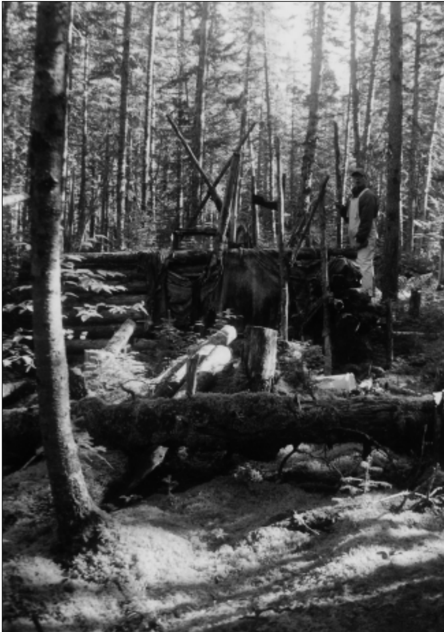
Photo 2 Tilt ou cabane de trappeur abandonnée. La structure atypique comprenait une toile de canevas qui aurait servi de couverture. Cette cabane se trouve à proximité de celle qui est illustrée sur la photo 1. Étant donné que les tilts étaient normalement espacés les uns des autres de plusieurs kilomètres, il est permis de suggérer que ces lieux connurent plusieurs épisodes d'occupation

métisse, car les techniques des Innus et des Inuits sont différentes (Turner 1979). Ainsi, à l'époque historique et même aux cours des récentes décennies, les Innus utilisaient surtout des pièges en métal obtenus de la HBC et au-dessus desquels ils érigaient une petite cache faite de branches et de feuillage pour fins de camouflage. Anciennement, les techniques autochtones étaient peut-être encore plus variées.