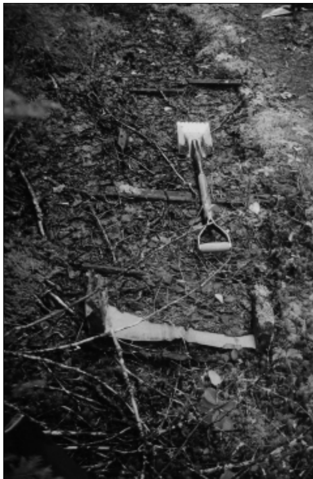
Photo 4 Vestiges de toboggan partiellement enfouis découverts sur un sentier longeant la rive sud du fleuve Churchill, aux environs de Muskrat Falls. Il demeure difficile d'attribuer ces vestiges à un groupe culturel particulier puisque les Métis et les autochtones ont incorporé ce mode de transport qu'ils ont emprunté des Innus, les premiers habitants de l'arrière-pays

Même si le compte rendu de Loder se rapporte aux débuts du xx e siècle, les pratiques et les croyances qu'elle évoque remontent sans doute au début du siècle précédent, et peut-être même davantage. Pour ce qui est du mouvement saisonnier, le changement de lieu d'habitation pour faciliter l'accès à certaines ressources commerciales ou de subsistance semble