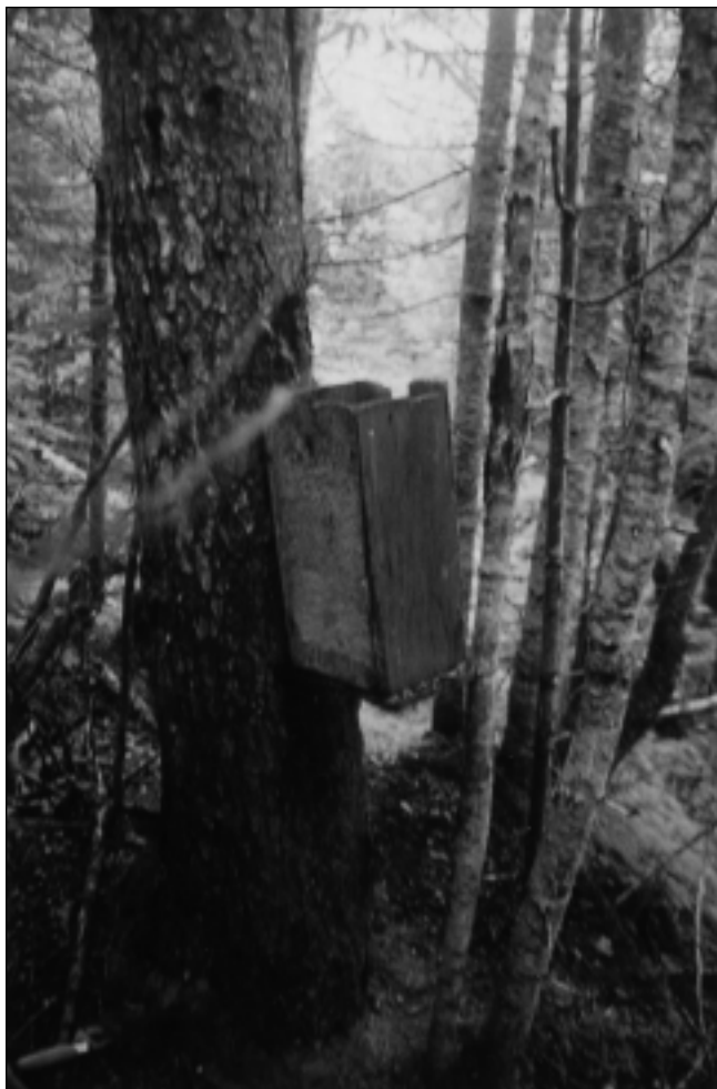
Photo 3 Piège à martre couramment utilisé par les Métis du Labrador. Dans cet exemple, le couvercle à bascule qui ferme normalement le dessus du piège est manquant

servaient de camp de base pour le sentier de piégeage de chaque famille. À l'extérieur de chaque maison il y avait une plateforme surélevée où l'on conservait la viande et le poisson gelés, hors de portée des chiens et des autres animaux. Chaque famille avait des chiens de trait et un bateau pour le transport [...] À cette époque, les gens étaient très pauvres par rapport aux standards monétaires, mais ils vivaient dans une communauté qui assurait réconfort et partage, et ils étaient riches en termes d'unité familiale. Si quelqu'un tuait un phoque, personne n'allait avoir faim. Chacun à son tour, on prenait soin des malades, on se présentait pour sortir ou remettre à l'eau les bateaux ou encore aider à bâtir une maison [...] à chaque printemps nous manquions de beurre et nous utilisions alors du lard ou même parfois le gras des animaux sur notre pain. Le gras d'ours était vraiment très bon [...] (Blake Loder 1989 : 10-11, 13)