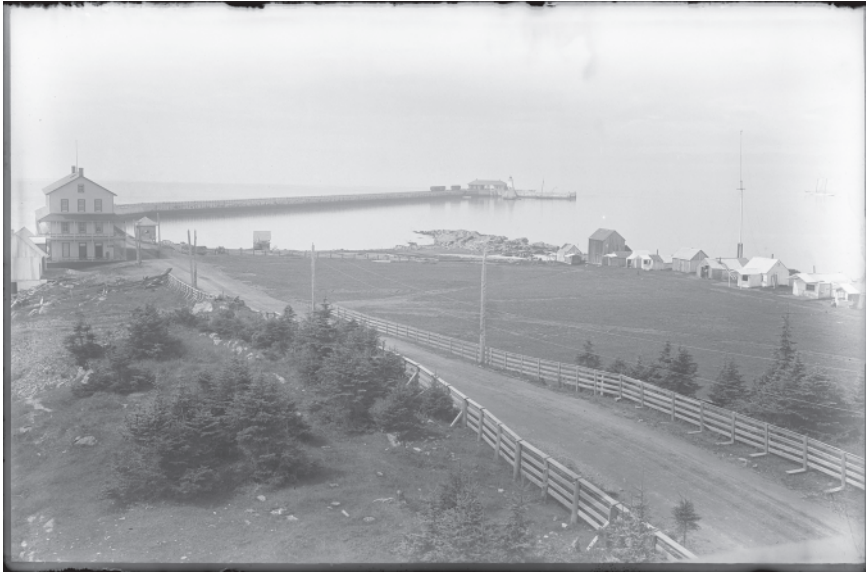
Figure 2 Le quai de Rivière-du-Loup, vers 1890