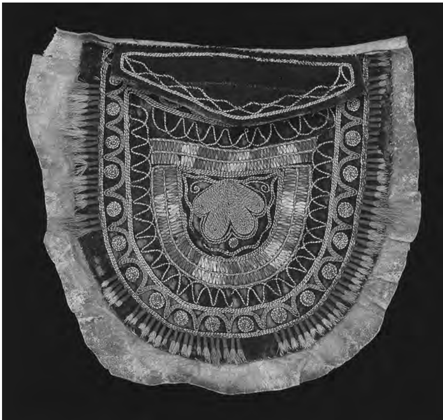
Figure 1 Sac à fond de forme ronde, probablement huron-wendat, peut-être acquis par Charles, premier marquis et second comte Cornwallis (1738-1805) Peau de chevreuil tannée à la cervelle, poils d'orignal et de chevreuil, piquants de porc-épic, fer étamé, tendon. Largeur 21,6 cm (Collection Thaw, Fenimore Art Museum, Cooperstown, New York, n° cat. T280.)