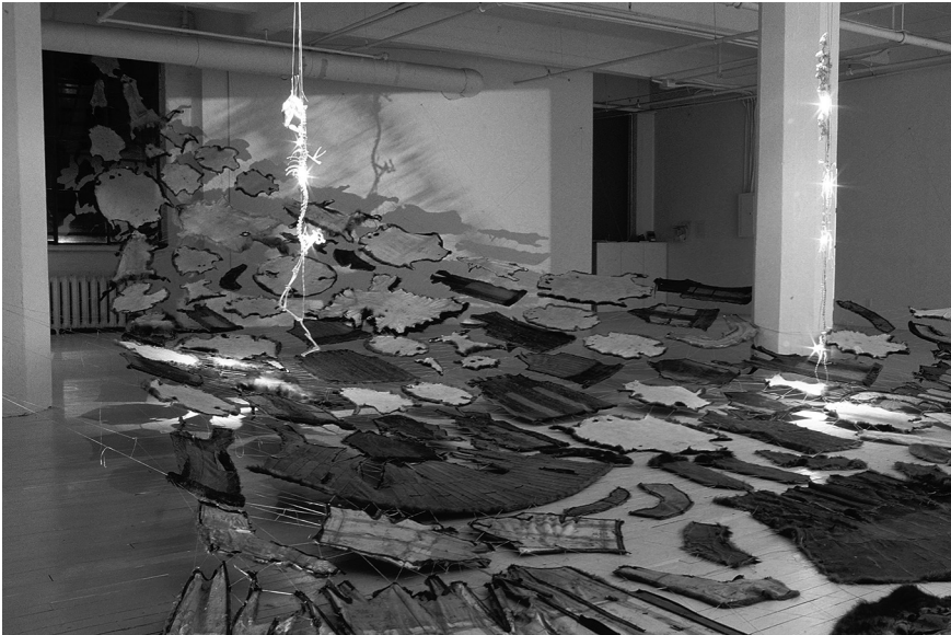
Dialogue entre elle et moi à propos de l'esprit des animaux , 2002, œuvre de Sonia Robertson. Installation in situ (peaux, fourrures, cordes, etc.), Centre d'art actuel Skol

de filiation unissant la nation atikamewk à ces esprits. Des notions d'harmonie et d'égalité remplacent implicitement les concepts de hiérarchie et de suprématie soutenus par les discours religieux catholiques. Par ailleurs, alors que les discours des missionnaires ont généralement été accompagnés par des tentatives de sédentarisation des peuples autochtones nomades ou semi-nomades, il est intéressant de considérer, selon les termes de Sioui Durand (2013 : 45), que « le caribou et l'orignal définissent la spiritualité, les us et coutumes, et les déplacements des nomades ». De par la substitution des figures christiques par des crânes d'animaux, on peut donc suggérer la présence d'une critique implicite du chamboulement du mode de vie traditionnel, entraîné en aval par l'arrivée de la religion catholique.