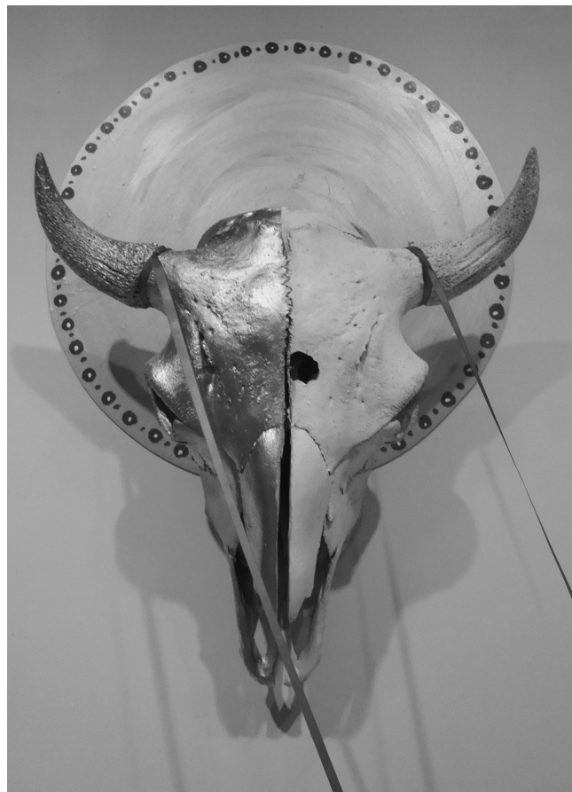
Icône : le sens du sacré [détail], 2009, œuvre d'Eruoma Awashish. Installation (crânes, fils, peinture, encadrement, etc.) (Photo Eruoma Awashish)

notions religieuses et les faire correspondre à leurs valeurs, à leur image. C'est d'ailleurs là que repose son objectif principal : démontrer la persistance de la culture autochtone malgré les dualismes et abus de tout ordre auxquels les Premières Nations ont dû faire face (Awashish 2014). Selon ses propres termes, « [e]n réutilisant les symboles qui proviennent de la religion catholique, c'est une façon pour moi de briser la relation de dominance que l'Église a longtemps eue sur le peuple autochtone, donc je me réapproprie certains symboles, je les réinterprète à travers mes œuvres » (Awashish, citée par Debeur 2014).