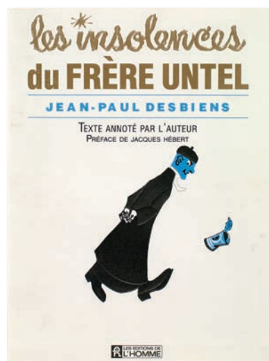
3. Jean-Paul Desbiens, Les insolences du frère Untel , texte annoté par l'auteur, Montréal, Éditions de l'Homme, 1988, 258 p. BAnQ, Collection patrimoniale [971.404 D443i 1988].

Si un livre demeure emblématique du déclenchement de la Révolution tranquille au Québec, c'est bien celui de Jean-Paul Desbiens : avec plus de 100 000 exemplaires vendus en six mois, le tirage de ce best-seller , tout en révélant le succès de la politique éditoriale dynamique mise en œuvre par les Éditions de l'Homme de Jacques Hébert 2 , démontre la forte résonance qu'a connue cet essai à couleur polémique. La genèse de cet ouvrage, son contenu, sa réception et ses effets sur la société québécoise de l'époque sont bien connus, notamment grâce à l'importante réédition parue en 1988 aux Éditions de l'Homme, annotée par l'auteur et augmentée d'une préface rétrospective de l'éditeur Jacques Hébert 3 (ill. 3). Les insolences ont été construites à partir d'un échange de lettres entre Frère Untel et l'intellectuel André Laurendeau, publiées entre novembre 1959 et avril 1960 dans le journal Le Devoir . Rédigé en une quinzaine de jours sur cette base, le livre de Jean-Paul Desbiens se compose de deux parties : « Frère Untel démolit », tout d'abord, où l'auteur laisse libre cours à sa verve de polémiste en mettant en cause, dans quatre chapitres, le système d'enseignement en vigueur au Québec, particulièrement en