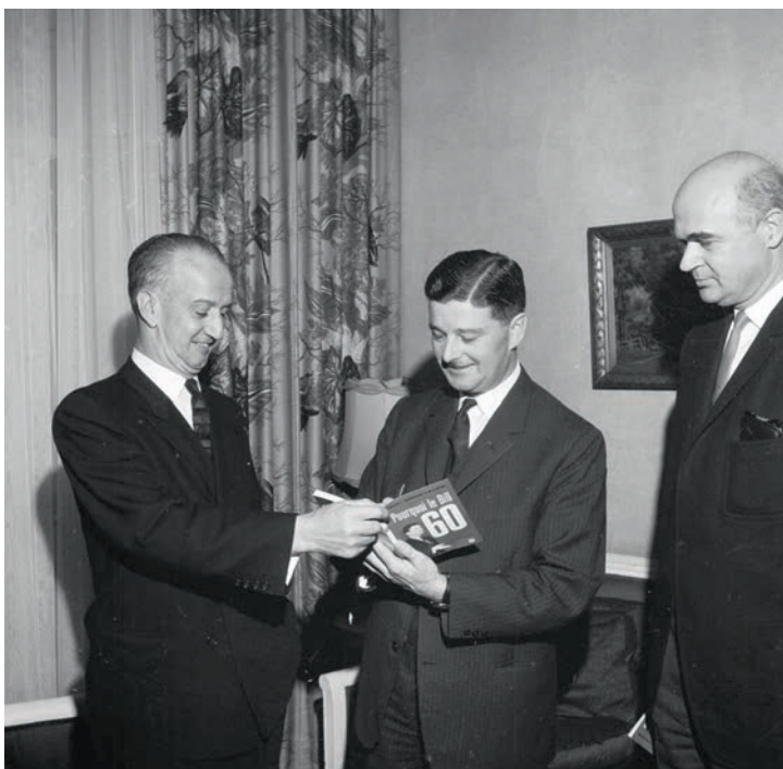
9. Paul Gérin-Lajoie (au centre), ministre de la Jeunesse de 1960 à 1964, deviendra ministre de l'Éducation en mai 1964.

Lancement du livre Pourquoi le bill 60 de Paul Gérin-Lajoie, 1963. BAnQ, Centre d'archives de Montréal, fonds Ministère de la Culture, des Communications et de la Condition féminine [E6, S7, SS1, D632518 à 632523]. Photo : Gabor Szilasi. Num.