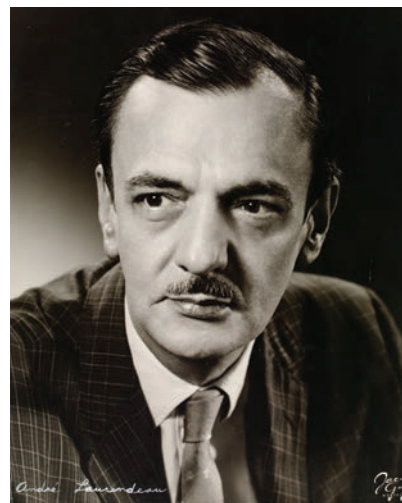
8. André Laurendeau, s. d.

J'en ai plein le dos, et depuis longtemps, de l'Europe. [...] Je reste dans ma chambre toutes les vacances de Noël. C'est le seul endroit où je suis le plus près d'être presque heureux. Le reste est lugubre. Il faudrait pourtant dire une fois pour toutes ce que c'est que « l'habitare fratres in unum ». Question d'être honnête. On ne dépassera pas Voltaire à ce sujet : s'assemblent sans se connaître, vivent ensemble sans s'aimer, se quittent sans regret 40 .