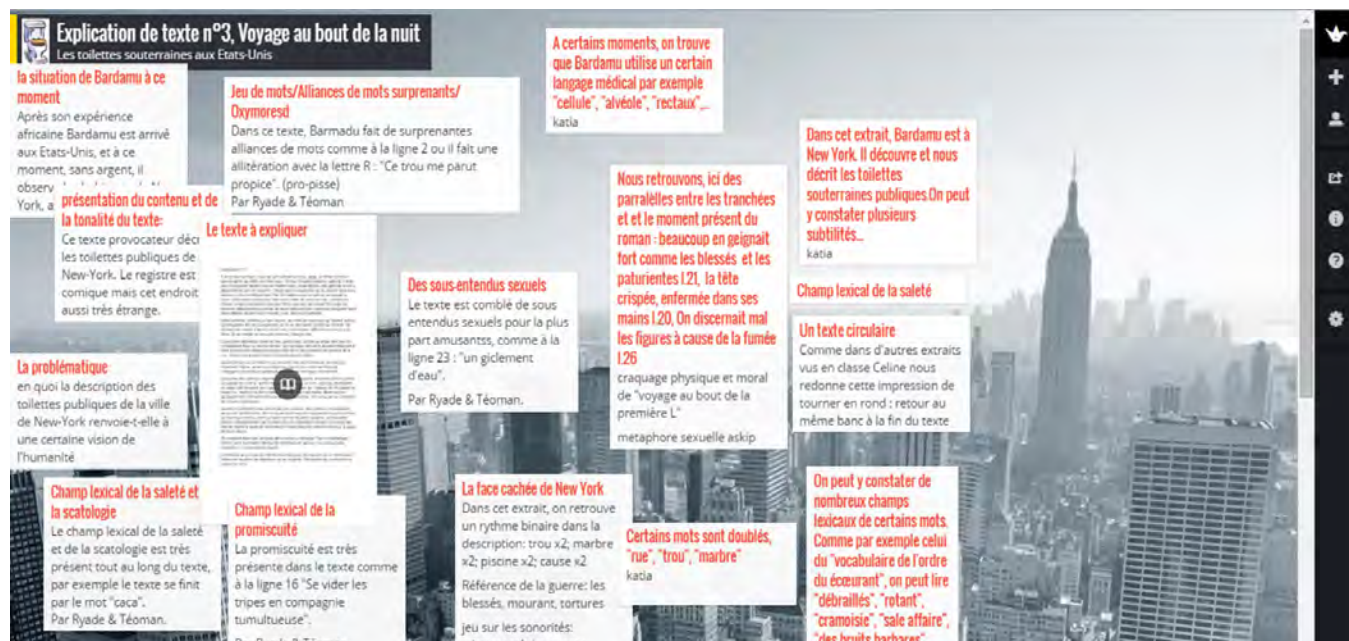
Illustration 10 : explication à partir du support Padlet

disposition de ces petits post-its qui se multiplient sur la page. Les lycéens peuvent lire les remarques faites par les autres groupes en direct et l'objectif, à ce moment, est d'essayer de ne pas répéter ce que d'autres ont déjà mis. Nous reprenons ensuite les brèves remarques des lycéens pour les trier, les mettre en ordre et réfléchir, à partir de ce support, à l'organisation d'un plan pour charpenter la lecture analytique. Les petits billets disposés sur le Padlet sont ensuite à réorganiser, comme les pièces d'une marqueterie, pour dessiner le commentaire collectif. Le tout sera de trouver un type d'organisation qui laissera de côté le moins de remarques créées sur l'écran commun possible. Les élèves se prennent au jeu et même les plus en difficulté tiennent à laisser leur marque sur le tableau commun. Ceux qui ne lèvent pas le doigt d'habitude peuvent écrire leurs petites remarques, c'est aussi une configuration qui convient bien aux timides. Voici un exemple du Padlet obtenu en suivant cette démarche, sur un extrait de Voyage au bout de la Nuit de Céline 6 . Il s'agit de la description des toilettes publiques souterraines de New York, de « À droite de mon banc » à ... « communisme joyeux du caca. » 7