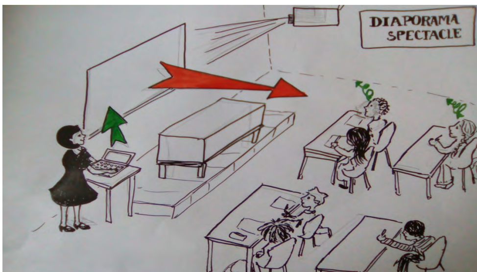
Illustration 5 : Schéma du dispositif « Diaporama-spectacle »

Cependant, à l'époque, même si je disposais d'un blogue, je ne mettais pas en ligne ces diaporamas pour les élèves, car je craignais qu'ils ne suivent pas le cours si je leur donnais le diaporama à la fin. Ils copiaient donc sagement l'explication dans leur cahier, diapositive après diapositive. Souvent, nous passions une semaine entière sur un texte. L'explication de « Quand vous serez bien vieille », par exemple, s'étend sur vingt-cinq diapositives. On peut dire que je visais une forme d'exhaustivité, et ces diaporamas traduisaient une sorte de perfectionnisme dans mon propre rapport aux textes étudiés, plus que dans le rapport établi entre les textes et les élèves et qui, avec le recul, me paraît à présent assez superficiel. Pour le professeur, arriver en classe avec un tel matériel, n'est-ce pas s'offrir le confort d'un cours complètement sécurisé ? Il s'agit à coup sûr d'un cours... sans surprise. Certes, les élèves eux-mêmes sont sécurisés, le professeur arrive avec des cours très solides, un travail très préparé. À l'époque, ils n'ont pas vu encore de cours utilisant des diaporamas, et cela leur paraît innovant, étonnant, au départ.