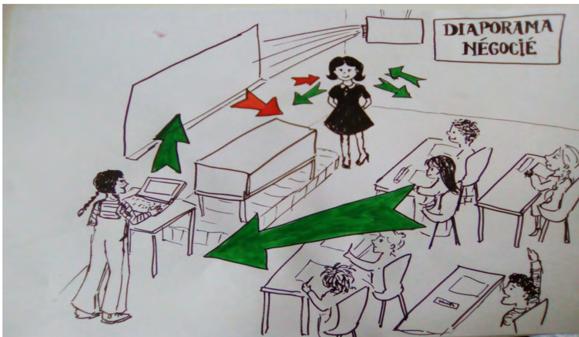
Illustration 6 : Schéma du dispositif « diaporama négocié »

Mais ensuite, je laisse des diapositives en blanc, et désormais, la formulation d'une problématique est le résultat d'une négociation avec les élèves. Même si j'ai moi-même préparé en amont une analyse du texte, je m'en détache (ou plutôt j'essaie de m'en détacher) pour écouter les élèves et faire émerger leurs propres remarques, qui sont d'ailleurs parfois meilleures que les miennes et nous emmènent sur des terrains imprévus, mais passionnants. Dans un premier temps, c'est moi qui note sur l'interface du diaporama, projetée au tableau, le résultat de l'analyse, puis comme cela m'immobilise derrière le bureau, je demande ensuite à un élève volontaire, doué pour écrire sur un clavier, de jouer le rôle de secrétaire de séance.