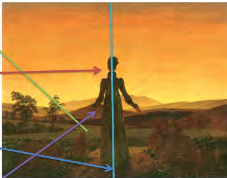
Illustration 1 : Exemple de diapositive — Femme dans le soleil du matin de Caspar David Friedrich (1818)

•Un personnage féminin exalté qui semble invoquer ou célébrer la nature (bras à demi-levés)