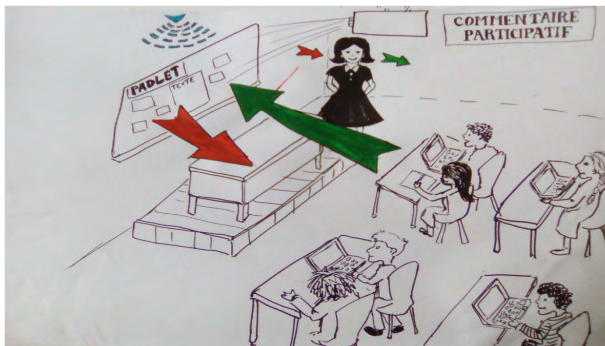
Illustration 9 : Schéma du dispositif de commentaires participatifs

À un moment de l'année, il se trouve que je dispose dans l'une de mes classes de quelques ordinateurs portables en état de fonctionner. Nous en prenons un pour trois élèves environ, et comme certains sont hors d'usage, nous avons recours également aux téléphones portables d'élèves qui ont une connexion Internet. Je ne pourrai bénéficier de ce dispositif que durant quelques mois 5 , mais j'en profite. Il y a de nombreuses façons de l'utiliser.