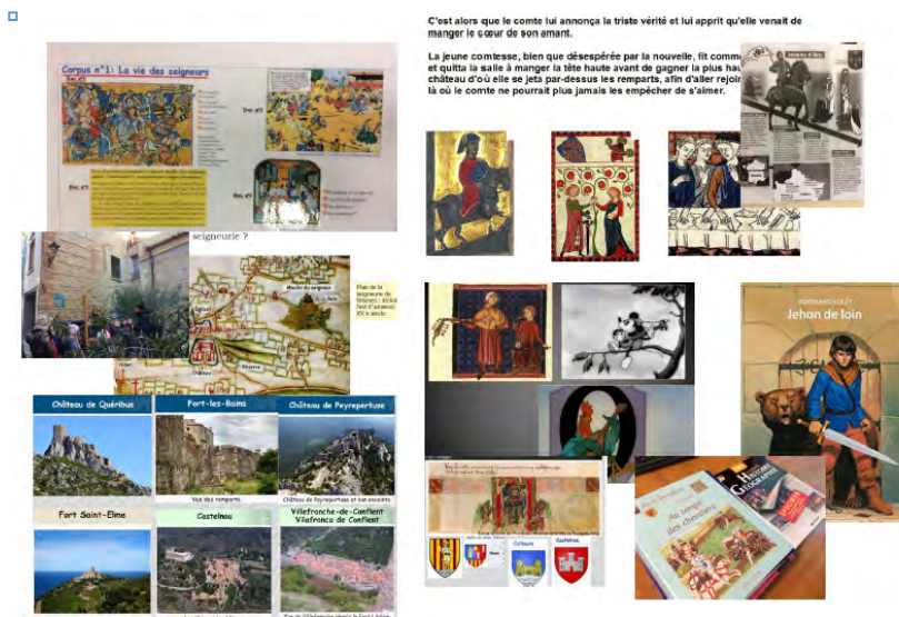
Illustration 1 : La diversité des documents retenus : l'exemple de l'enquête 1 (France)

[...] propice aux interrogations, aux échanges, à la méthodologie et au savoir-faire dans la lecture et le traitement des différents supports. (Léon, entretien 1)