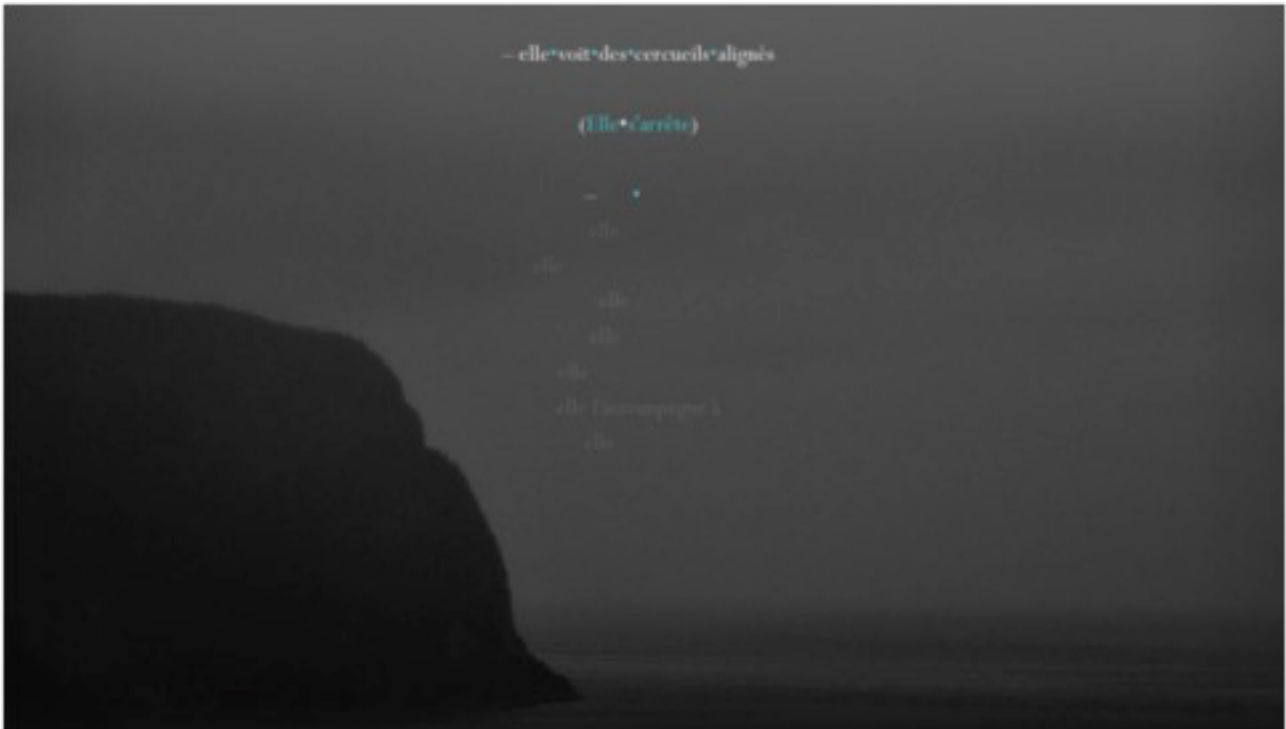
Illustration 2 : Page en mode plein écran ; un ruban de texte éphémère, en gris, sera amené à disparaître à mesure que la photographie, progressivement, s'éclaircit

simplement dans le sens de lecture linéaire du livre papier. Ce qui permet à la fois une architecture simple (succession de tableaux qu'on peut suivre dans l'ordre chronologique si on le souhaite) et une approche plus libre et ludique du livre (naviguer au gré de ses envies en passant d'une image à une autre). Le menu vertical qui permet de passer facilement d'une photo à une autre sans dépendre nécessairement de l'ordre chronologique des textes (la navigation s'opérant alors via des flèches de part et d'autre de chaque page) peut facilement être masqué par le lecteur d'un clic ; c'est une fonctionnalité de base incluse dans le squelette utilisé.