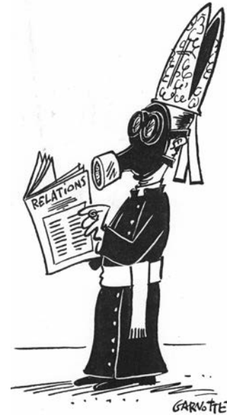
Garbette, paru dans Nouvelles CSN . Encre de Chine sur bristol

Je suis d'accord sur le fait que cette dimension a souvent été laissée de côté. Nous reviendrons sûrement sur les raisons de cet «oubli». Mais c'est précisément dans la réappropriation de cette part oubliée, au moyen