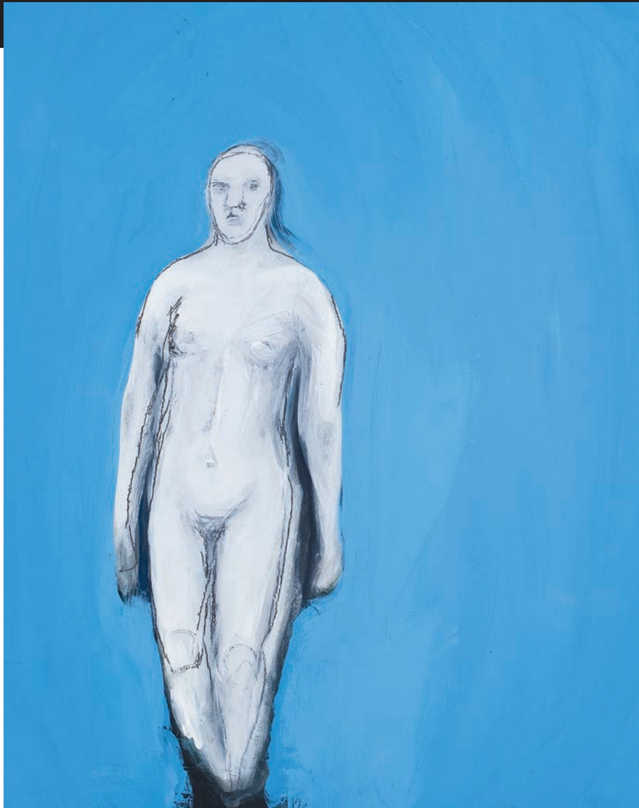
Laurence Cardinal, Sans titre T4 , 2009, acrylique sur bois, 38 x 45 cm.

Longues sont les luttes des femmes. Fondamentalement ancrées au désir et à l'impératif de faire advenir la justice sociale en ce monde, leur persistance ne fait aucun doute à l'heure où de jeunes féministes ont participé en tant que telles au printemps québécois – pour l'accès à l'édu-