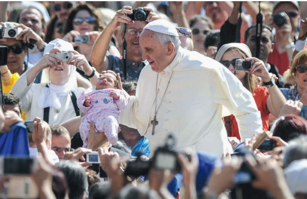
François, un pape qui veut être près des gens.

sur la vie conjugale, la contraception, l'homosexualité, la sexualité hors mariage et l'accès des divorcés remariés à la pleine communion. Il faut résoudre ces questions, dit-il, en faisant appel à la miséricorde. Les réponses ont été envoyées aux évêques des diocèses qui ont produit une synthèse destinée à être envoyée à Rome. Certains épiscopats dans le monde ont rendu les résultats publics, alors que les épiscopats québécois et canadien n'ont pas voulu le faire. Il est d'ailleurs dommage que des évêques, manquant d'enthousiasme à l'égard de cette initiative novatrice, n'aient pas fait suffisamment d'efforts pour la faire connaître davantage dans les paroisses.