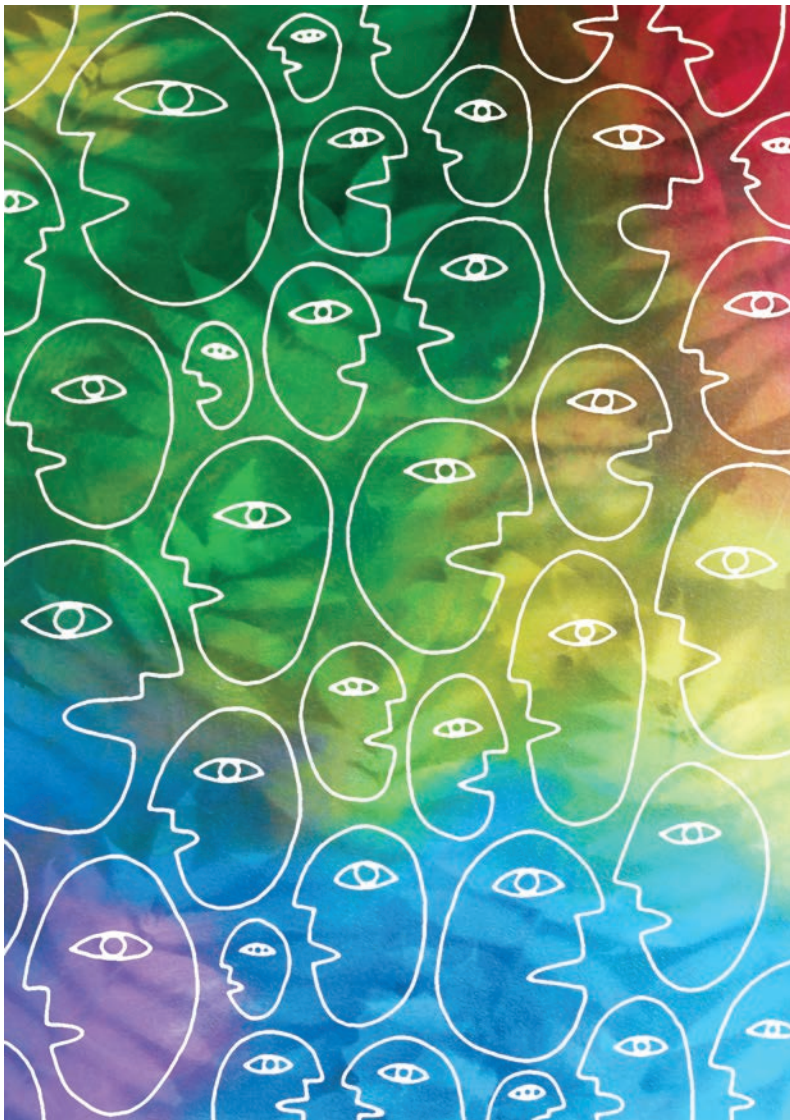
Éric Godin, Ensemble N°2 , acrylique sur toile et montage numérique, 61 x 91,4 cm

authentiques et pures de vrai, de beau, et de bien dans l'activité d'un être humain se produisent par un seul et même acte, une certaine application à l'objet, de la plénitude d'attention» ( La pesanteur et la grâce , 1947).