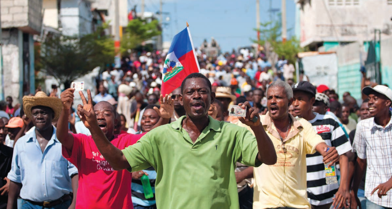
Manifestation à Port-au-Prince, le 26 octobre 2014, pour exiger des élections locales et législatives qui tardent depuis trois ans.