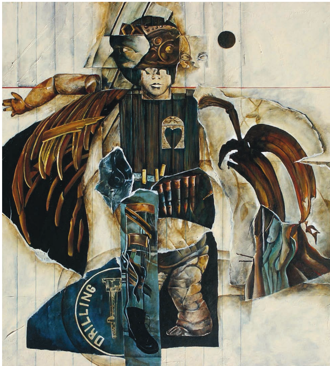
Brigitte Normandin, Séquelles et raisonnement , 2005, acrylique sur toile, 105 x 121 cm