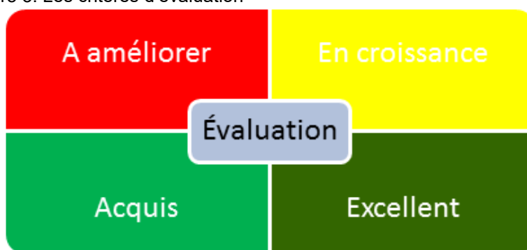
Figure 3. Les critères d'évaluation

Des barèmes de ces critères d'évaluation, aussi exclusifs que possible, ont été rédigés pour chaque compétence. Ces barèmes permettent une évaluation plus équitable puisque plusieurs enseignants participent à l'évaluation de l'élève et peuvent s'y référer. Afin de renforcer l'aspect pédagogique de l'outil, l'élève lui-même participe au processus en s'autoévaluant, ce qui permet aux enseignants de comparer leurs cotes avec celles de l'élève. La figure suivante montre l'environnement consulté par les enseignants et les élèves pendant le processus d'évaluation. L'évaluation de l'enseignante s'affiche sous forme de crochets, alors que celle que l'élève porte sur lui-même apparaît sous la forme des carrés ombragés.