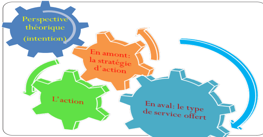
Figure 3. En amont et en aval

retrouvent en aval comme résultats de l'action entreprise? Il n'y a pas une réponse possible mais plusieurs.