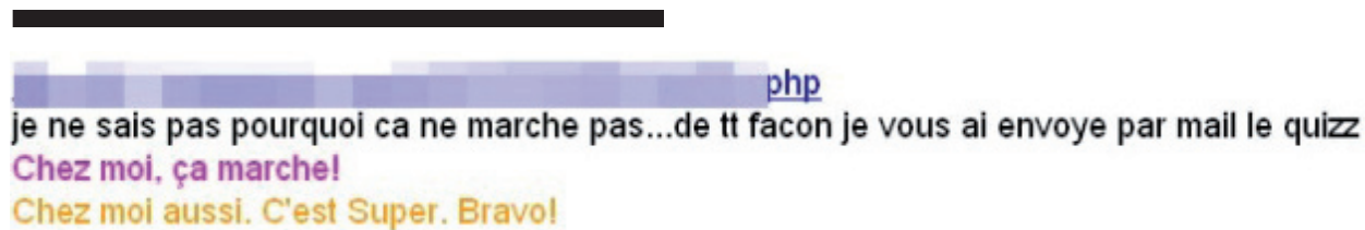
Figure 3. Copie d'écran partielle du wiki montrant une interaction entre les scripteurs

Un dialogue s'instaure ainsi entre les différents scripteurs sur le wiki lui-même, mais il s'efface au fur et à mesure de la mise en édition. Ainsi, la pratique d'un wiki permet non seulement l'accès aux modifications textuelles, mais également aux échanges écrits qui ont été transmis par ce support.