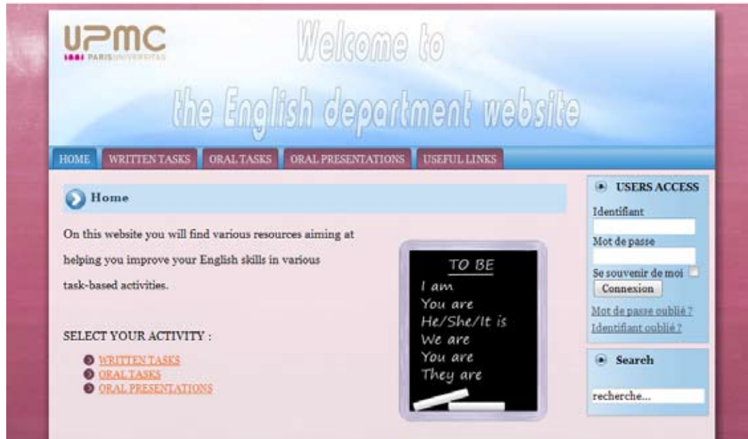
Figure 2. Page d'accueil de l'assistant pédagogique en ligne

Les aides en ligne ainsi réparties permettent une navigation sur des pages moins « chargées » en informations et limitent donc les effets de surcharge cognitive d'information et/ou de désorientation (Rouet, 2000).