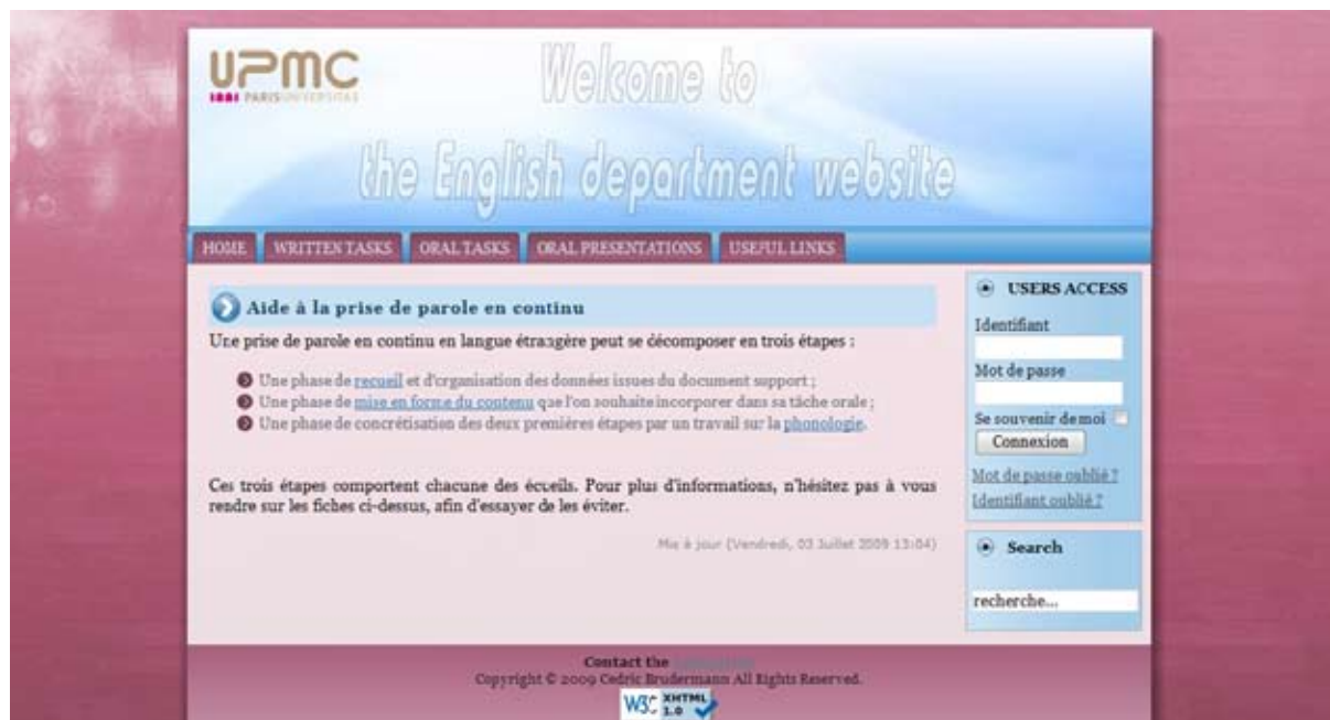
Figure 5. Guidage sur l'assistant en ligne pour la réalisation de tâches orales

est susceptible d'engendrer un sentiment d'anxiété existentielle chez les apprenants (Rardin, cité par Young, 1992), le but de l'assistant en ligne sur l'espace d'aide à la production orale est de les aider à surmonter leur sentiment de blocage lorsqu'il s'agit de produire en L2. Pour ce faire, trois volets distincts ont été prévus dans le guidage à distance pour permettre aux étudiants d'intervenir eux-mêmes sur les « problèmes phonologiques » mis en évidence dans la typologie (figure 5).