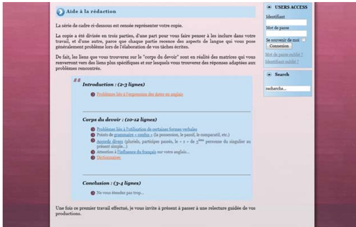
Figure 4. Guidage sur l'assistant en ligne pour la réalisation de tâches écrites

De même, puisque la majorité des problèmes de la typologie appartenaient à la catégorie morpho-syntaxique et sémantico-syntaxique, des aides ont été prévues et classées en diverses sous-catégories, de façon à ne pas surcharger d'informations les pages de l'application en ligne et à encourager les apprenants à se rendre sur les liens proposés. En organisant les informations de la sorte, l'assistant pouvait ainsi constituer une aide pour les problèmes dérivant de « l'utilisation de certaines formes verbales » en anglais, des « points de grammaire confus » et des « accords divers ». À côté de ces intitulés, des exemples de problèmes ont été ajoutés entre parenthèses pour guider l'apprenant dans ses choix de navigation. Ces derniers ont été choisis parmi les points qui, en volume (d'après l'étude de Perpignan), posaient le plus de problèmes, car susceptibles de toucher le plus d'étudiants et à être utilisés avec le plus de fréquence.