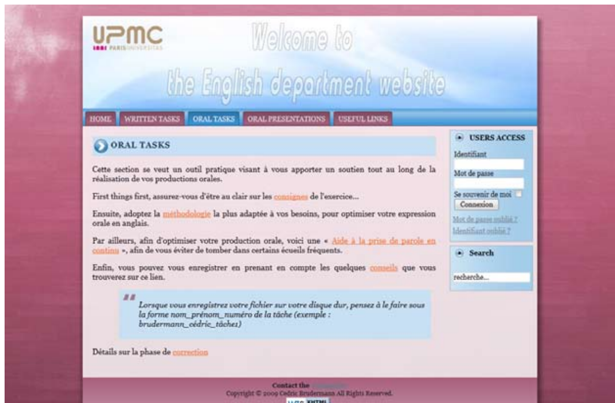
Figure 3. Page d'accueil de la section « tâches orales »

Enfin, comme les aides en ligne accessibles ont été choisies en fonction des diverses entrées de la typologie, un des buts du site était de permettre aux apprenants d'éviter, autant que possible, de faire des fautes sur ces aspects, non seulement parce que, comme nous l'avons déjà évoqué, ils y avaient déjà été sensibilisés, mais aussi parce que l'assistant en ligne leur fournissait à présent les moyens d'avoir recours à ces aides dans un espace les centralisant.