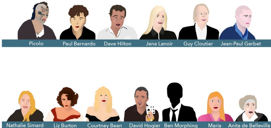
Figure 2 Les personnages développés dans le cours

Certains cas utilisés sont réels et relèvent du domaine public tandis que d'autres personnages sont des amalgames pour servir les contenus à aborder (figure 2). À chaque cours, les étudiants découvrent un nouveau personnage par le biais d'une étude de cas qui les positionne dans un rôle d'intervenant, et ils ont pour défi de lui venir en aide, tout en développant leurs compétences en intervention sociale.