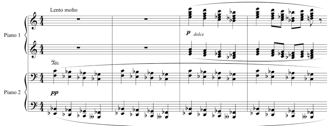
Figure 3 : Alfredo Casella, Pagine di guerra , op. 25, « In Francia. Davanti alle rovine della cattedrale di Reims » (1915).

mouvement, Casella rend non seulement hommage aux alliés de l'Italie, mais s'inscrit également dans l'actualité et s'associe à la lignée des artistes français de son époque. En détruisant la Cathédrale de Reims, les Allemands portaient atteinte à tout un pan de l'histoire et à un symbole plus que significatif de la culture française 17 . L'œuvre de Casella est empreinte d'un certain impressionnisme rappelant La cathédrale engloutie de Debussy. D'autres passages rappellent également, par leur tessiture et l'utilisation d'accords parallèles, En blanc et noir de Debussy.