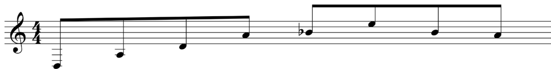
Figure 4 : Arpège de Crash – transcription.

Outre des couleurs et des matières, cette partition fait également entendre différents mouvements et ce dès le thème principal qui oppose ainsi trois mouvements sonores, joués simultanément par les trois groupes de guitares/harpe : celui, monolithique, de quintes à vide parallèles (figure 2), auquel s'ajoutent l'ondulation d'un accompagnement continu en arpèges ascendants-descendants – qui résulte de la répétition-variation d'un arpège initial (figure 4) –, puis le mouvement conjoint (ou presque) et sinueux d'une ligne mélodique chromatique tournant autour d'elle-même (figure 5).