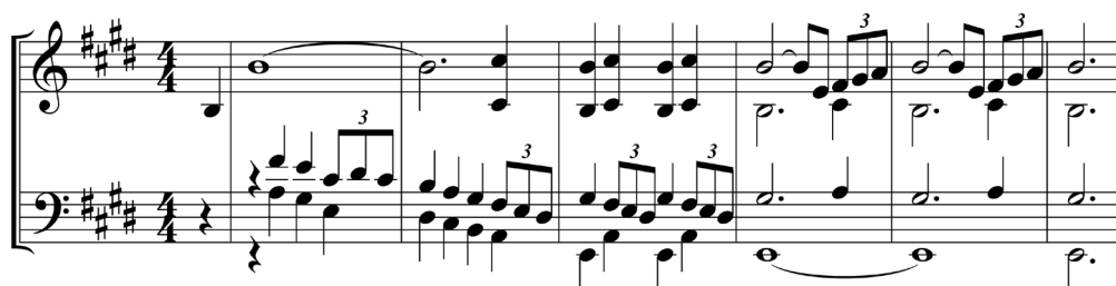
Figure 1 : A Dangerous Method, thème de l'Idylle (mesures 1 à 6), piano – transcription.

S'il s'agit ici d'une des rares fois où la musique se réfère directement à celle d'un autre compositeur, ce n'est cependant pas la première fois que Shore fait appel à d'autres musiciens : Ornette Coleman dans Naked Lunch , le groupe Metric dans Cosmopolis . Ce dernier film marque un retour à l'électronique, délaissé depuis Crash : synthétiseurs, guitares électriques distordues et traitement électronique dominent cette bande sonore new wave rythmée, aux sonorités industrielles et urbaines. Dans Crash , Shore utilise une instrumentation singulière mêlant trois groupes constitués d'une harpe et de deux guitares électriques auxquels s'ajoutent le traitement électronique et le montage sonore. L'expérimentation sonore est ici aussi celle du langage, le compositeur exploitant des échelles modales renforçant la modernité et l'étrangeté du film.