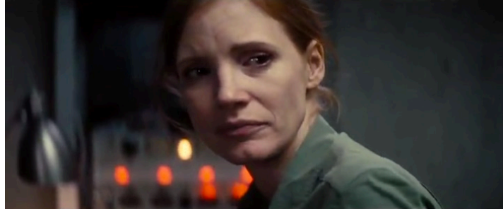
Extrait vidéo 3 : Christopher Nolan, Interstellar, le professeur Brand Murph évoque auprès de Murph l'absence des êtres chers et sa crainte du temps qui passe, 01:22:48-01:24:21

délicatesse le chagrin de la jeune femme puis la souffrance liée à l'absence des êtres aimés lors du dialogue entre Murph et le professeur Brand, alors que celui-ci évoque Amelia et lui fait part de ses angoisses face au temps qui passe (extrait vidéo 3).