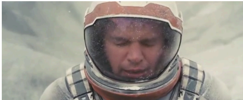
Extrait vidéo 2 : Christopher Nolan, Interstellar, Cooper agonise sur la planète glacée tandis que, sur Terre, Murphy fait demi-tour pour retourner vers la maison de son frère, 01:55:54-01:58:01 © Warner.

Elle invite alors à nuancer l'affirmation selon laquelle chez Zimmer, la « composition refuse toute complexité, toute orchestration singulière, et se destine à souligner la figuration physique d'une action » (Berthomieu 2004, p. 73). L'accompagnement orchestral crée un effet de suspens hypnotique qui surligne subtilement la dimension tragique de la scène par son caractère mélancolique, sans pour autant verser dans un soulignement emphatique ou un quelconque excès mélodramatique. Se déroulant quasiment sans modification tout au long de la scène, l'accompagnement unifie les actions concomitantes présentées en montage alterné et lie ainsi étroitement l'agonie de Cooper et le refus de Murph de renoncer à sauver la famille de son frère, comme si l'issue heureuse de l'une dépendait de la prise de décision de l'autre : Murph et Cooper mènent chacun de leur côté une lutte capitale, l'un pour sa survie, l'autre pour celle de ses proches. Enfin, la même musique s'appliquant à tous les personnages sans variation en fonction de la présence de l'un ou de l'autre à l'image, Mann est dépeint moins comme un meurtrier impitoyable que comme une figure tragique, un astronaute héroïque déchu, dont les failles résident justement dans son incapacité à accepter de vivre coupé de tout lien avec le reste de l'humanité jusqu'à la fin de ses jours et de mourir dans la solitude la plus absolue (extrait vidéo 2).