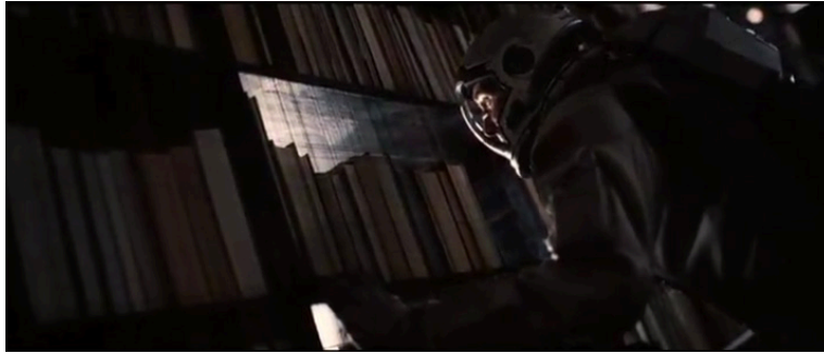
Extrait vidéo 5 : Christopher Nolan, Interstellar , Cooper observe Murph depuis le trou de ver alors que celle-ci découvre l'identité de son « fantôme », 02:24:48-02:26:45.

La musique n'appuie pas la tragédie familiale qui se noue ici, ni les cris de désespoir et la rage de Cooper, ni la compréhension soudaine de Murph que son « fantôme » n'était autre que son père lui-même et sa joie émue : la partition nimbe l'ensemble de la scène d'un halo mélancolique très doux sans en suivre l'évolution formelle et dramatique (extrait vidéo 5).