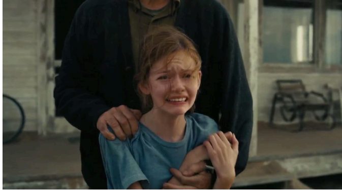
Extrait vidéo 8 : Christopher Nolan, Interstellar , Cooper quitte sa famille, 41:31-42:32 © Warner.