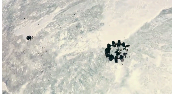
Extrait vidéo 7 : Christopher Nolan, Interstellar, Cooper tente une manœuvre désespérée pour s'amarrer à l'Endurance, 02:07:45-02:09:46 © Warner.

entre la musique et le sound design et cohabitent parfaitement avec les bruitages à proprement parler. La puissance sonore qui résulte ici de l'écriture de Zimmer et du mixage est telle que de nombreux internautes ont qualifié cette séquence d'orgasme auditif (« eargasm ») !