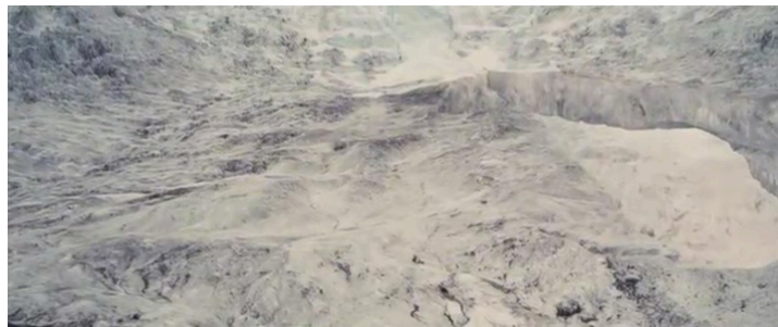
Extrait vidéo 1 : Christopher Nolan, Interstellar , Mann attaque Cooper après avoir avoué sa lâcheté, 01:53:01-01:54:07 © Warner.

La ponctuation de marimbas se poursuit sur les plans suivants du montage alterné, soulignant l'impuissance de Murph à convaincre son frère de quitter la maison pour sauver sa famille (extrait vidéo 1).