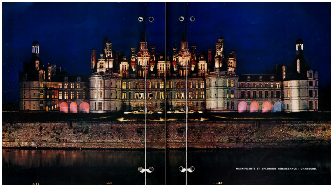
Figure 1 : La façade de Chambord lors du premier spectacle son et lumière de 1952.