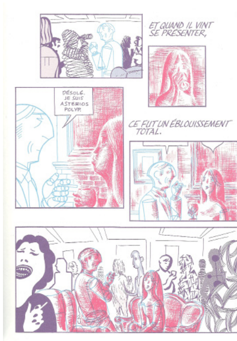
Fig. 1 - Mazzucchelli, D. (2010 [2009]). Asterios Polyp .

geste réflexif, n'empêche pas la nature polygraphique de l'œuvre d'être naturellement autodéictique, en tant qu'elle rend sensible son caractère artefactuel, autrement dit son statut d'objet matériel et construit, par la discontinuité stylistique et l'outrance de ses procédés. Chacun de ces réseaux réflexifs ne recoupe toutefois pas le jeu de la métalepse finale par laquelle le héros se débarrasse de feu son frère jumeau jusqu'alors narrateur d'outre-tombe : celui-ci n'aura plus l'occasion de gloser ironiquement la nature mixte du récit ("je ne vais pas vous faire un dessin"), puisque Asterios, prenant conscience de ce qu'il est "le héros de [s]a propre histoire", se confronte alors à son double, et que le lettrage narratorial s'invite dans des phylactères qui lui permettent de se battre d'égal à égal avec son double intradiégétique pour s'assimiler la biographie du personnage principal. Le jumeau narrateur avait sans doute prévu cette confrontation ("Asterios pourra vous le dire mieux que moi") qui le fait passer dans la diégèse puis disparaître. Mais cette scène, aussi onirique soit-elle, ne met pas seulement fin à la binarité existentielle du héros : elle trouve précisément à se réaliser par la seule qualité de la graphie, puisque ni le récitant évincé ni la figuration des sosies ne sauraient opérer, ensemble ou séparément, cette transgression.