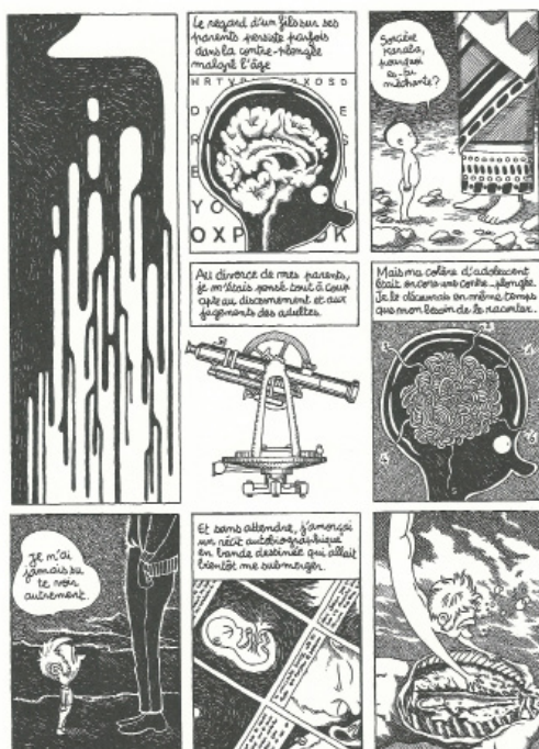
Fig. 2 - Mussat, X. (2014) Carnation .

Ces hétérodoxies sont peut-être en partie tributaires du modèle littéraire de l'autobiographie, quelque part qu'il ait pu prendre à la légitimation de la bande dessinée par ailleurs. De même, lorsque David Mazzucchelli reprend, avec Paul Karasik, le roman Cité de verre de Paul Auster, ils y exacerbent la réflexivité littéraire (et dactylographiée), par la force, pour ainsi dire, de l'adaptation. La réciproque est vraie : tout en ayant réalisé nombre de bandes dessinées réfléchissant leur dispositif propre (des mises en abyme infinies de planches aux cases vides et aux échappées hors de la diégèse, c'est-à-dire hors du décor et du gaufrier), Marc-Antoine Mathieu déplace le centre de gravité de la réflexivité dans l'album Le Dessin où ce sont bien les arts plastiques qui sont au cœur de sa "réflexion" en tant qu'auteur – et plasticien, en l'occurrence, puisqu'il expose aussi. Dans tous ces cas, un médium est hypertrophié au détriment d'un autre pour tenir lieu de l'ensemble – dissymétrie hétéroréflexive qui témoigne d'une réappropriation des formes littéraires ou picturales, dont le prestige invasif ne menace plus l'intégrité de la bande dessinée.