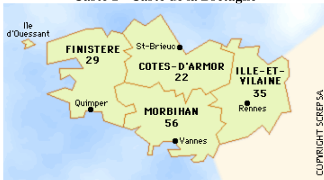
Carte 1 - Carte de la Bretagne