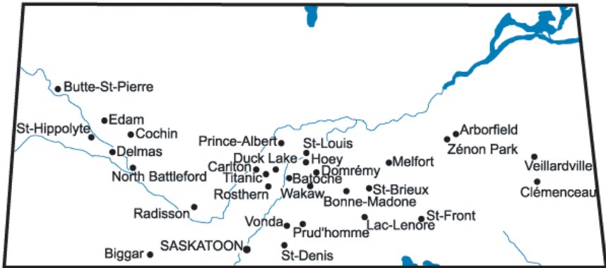
Figure 2 : Communautés francophones du nord de la Saskatchewan