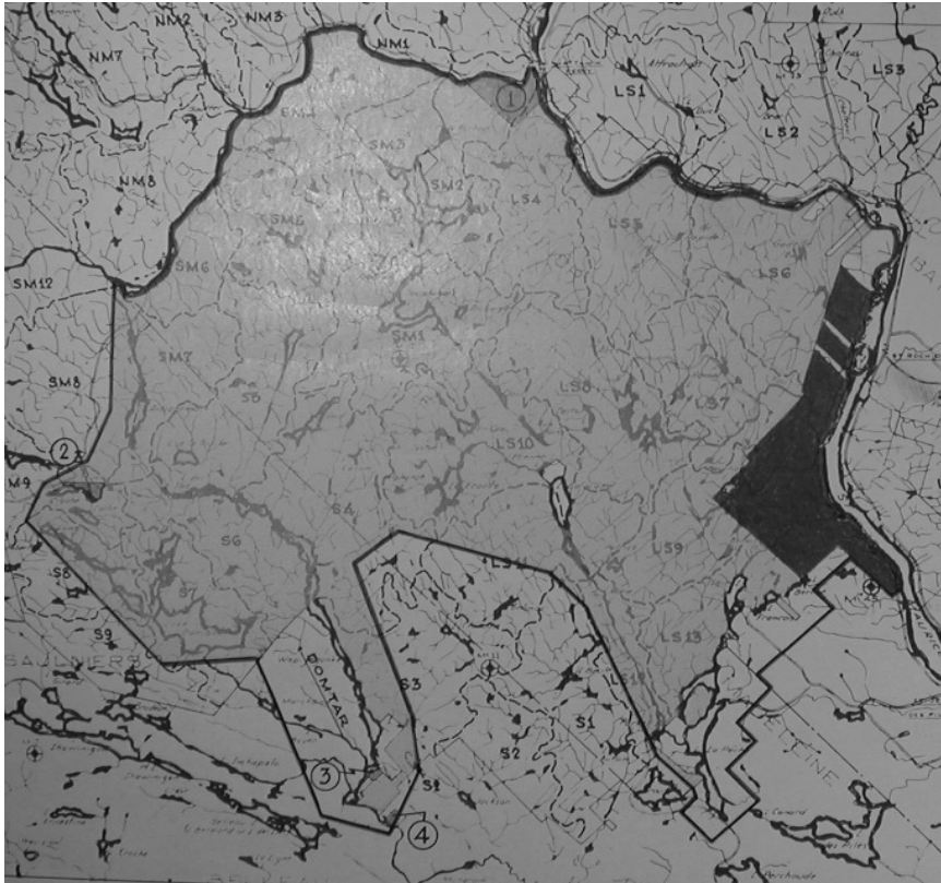
Figure 1. Exploitations et tenures des terres avant 1972 sur le territoire du parc national de la Mauricie, 1959-1972. En gris foncé, les concessions forestières provinciales de la Consolidated-Bathurst (CB); en gris pâle, les terres privées de la CB (la plantation de Grand-Mère); en blanc, au sud-ouest du parc, les terres de la Domtar.

Source : Grand-Mère, Consolidated-Bathurst ltée, Université du Québec à Trois-Rivières, cartothèque, +615.43GCRKIN (Q) CaQTU.