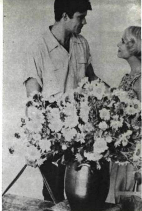
Le Bonheur, d'Agnès Varda

Même si l'auteur s'en défend à coups d'interventions et de mises au point dans les journaux et revues, le film s'appuie sur une thèse : la thèse naturaliste et évolutionniste. "Le bonheur, c'est peut-être la soumission à la nature", dit Paul Meurisse dans Le Déjeuner sur l'herbe , film de Jean Renoir auquel se réfère le réalisateur par le truchement d'un téléviseur. Peut-être, mais elle oublie que la nature de l'homme comporte la raison qui transforme son cœur. Ni les arbres, ni la rivière, ni les animaux ne lui sont exemplaires. "L'homme n'est ni ange ni bête... qui veut faire l'ange fait la bête" a écrit Pascal. Agnès Varda montre ce qui arrive lorsque l'homme fait la bête. Le ménage de François et Thérèse vit "selon l'ordre naturel". Lui est menuisier, elle, couturière; à la fin de la journée, ils se retrouvent, se sourient, font l'amour, jouent avec des enfants ravissants (remarquez que les enfants babillent continuellement, ne pleurent jamais); en fin de semaine, ils s'évadent à la campagne, "pique-niquent" gentiment, re-font l'amour dans un paysage détendu, rient, et reviennent tout bonnement à la maison; et le travail recommence le lundi matin sous le signe du beau temps. Aucune ride, aucune faille dans cette vie; ils ne se querellent jamais (pourquoi se quereller? il n'y a pas de problème...). Mais lui possède une étonnante puissance