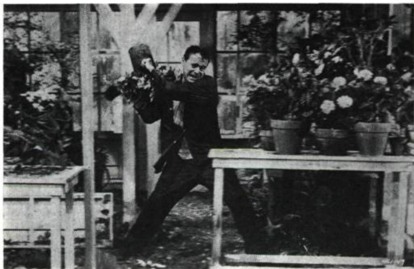
Days of Wine and Roses, de Blake Edwards

livre à la drogue et on voit en quelle compagnie il est tombé. Il a beau cacher son état, il finit par se trahir et par découvrir son "mal" à sa femme. L'habitude de la "poignée de neige" est une tyrannie affreuse. Il lui faudra une cure patiente et sérieuse pour briser ces chaînes. On le voit, chaque fois qu'une passion s'installe dans l'homme, c'est presque infailliblement la liberté qu'elle met en déroute.