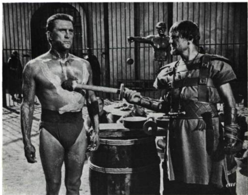
Spartacus , de Stanley Kubrick

efforts scolaires de Walt Disney avec Johnny Tremain .