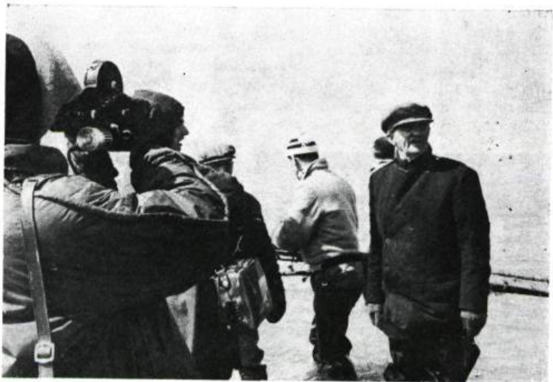
Pour la Suite du monde, de Pierre Perrault