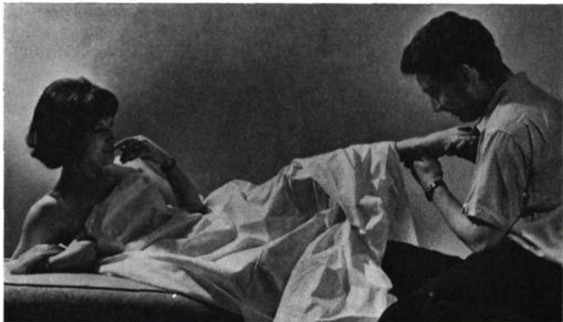
A tout prendre , de Claude Jutra

ou à l'aide de capitaux privés. Le premier s'appelle A tout prendre . Il est de Claude Jutra, qui, malgré l'insuffisante complaisance d'un scénario autobiographique et facétieux, a le mérite premier d'improviser son pouvoir de fiction en rejetant l'éternel document-vérité, d'offrir au cinéma québécois les vertus de l'individuel et de l'imaginaire dans un montage souple et élégant, d'une facture très personnelle.