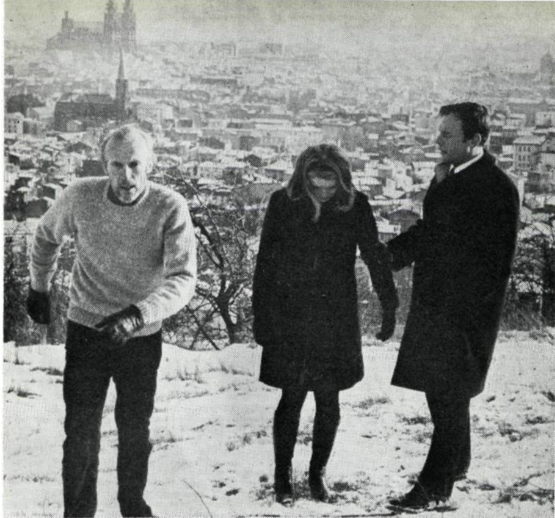
Eric Rohmer (à gauche) tournant Ma nuit chez Maud