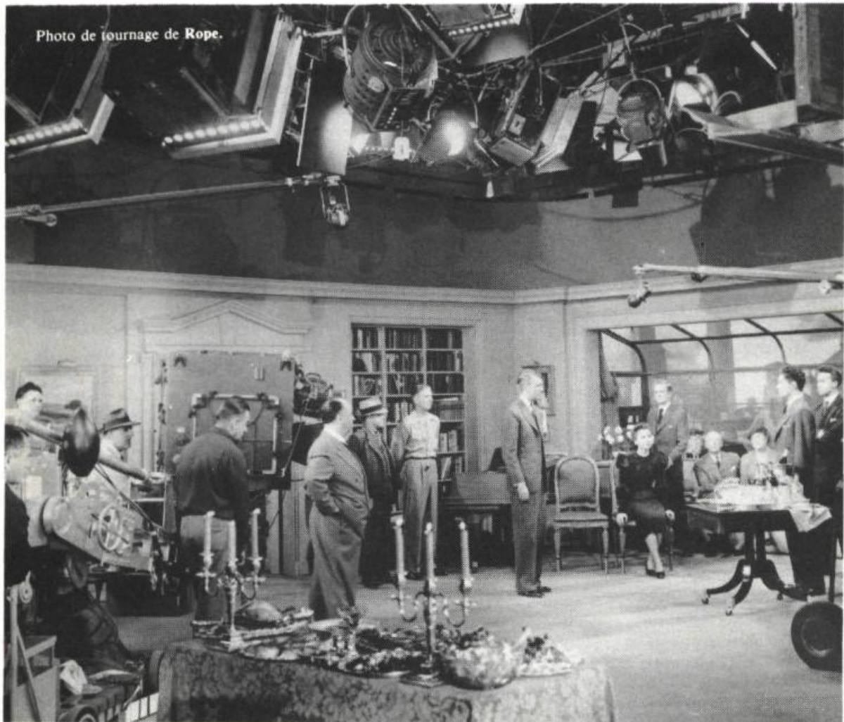
Photo de tournage de Rope .