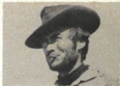
... Et pour quelques dollars de plus