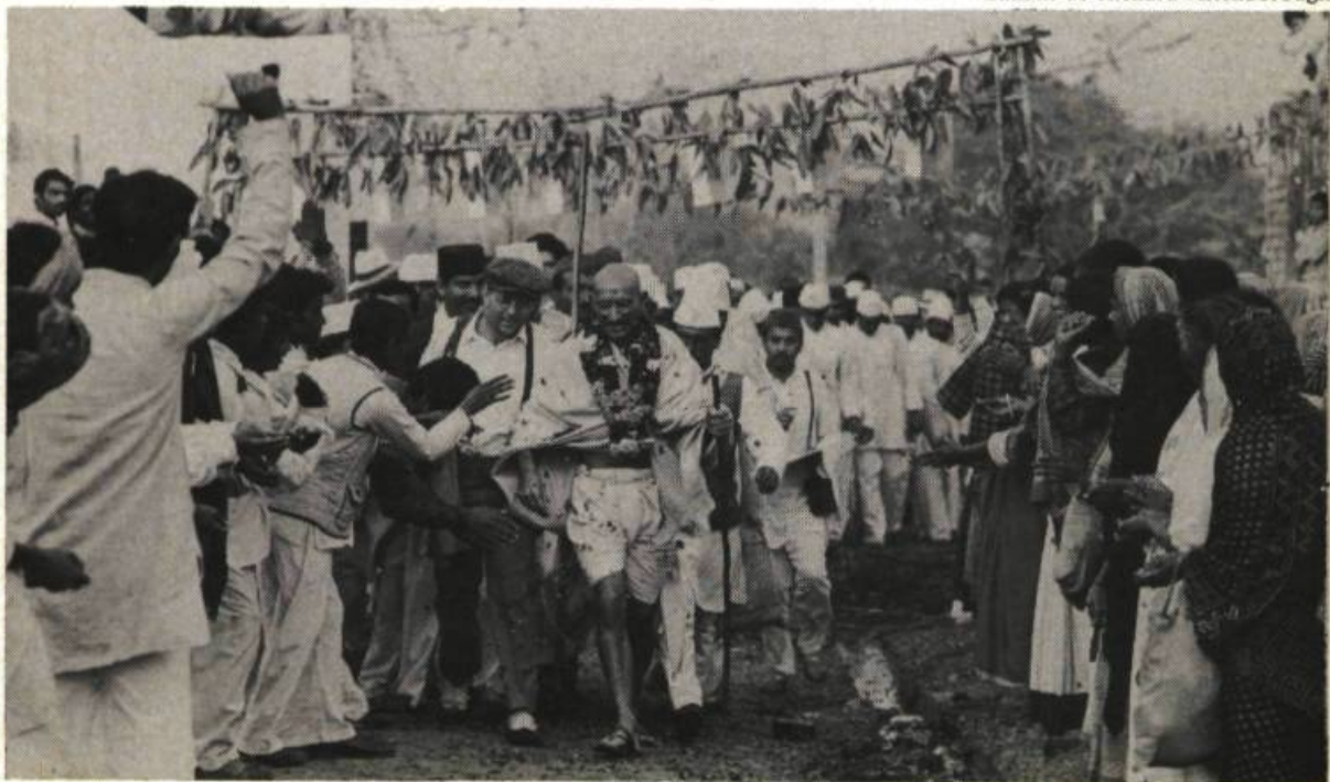
Gandhi de Richard Attenborough