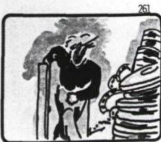
ENTRE UN MARC DÉCHAÎNÉ...