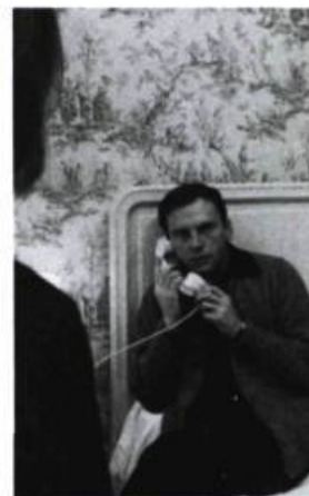
Un homme et une femme

Pour l'homme qui proclame sans hésiter que presque tous ses films, à la limite, pourraient s'appeler Un homme et une femme , faire des films revient à faire et à refaire toujours le même. Reste à savoir si cette affirmation est une citation destinée à le réconcilier avec ses détracteurs ou si elle dérive de cette naïve candeur qui lui est propre.