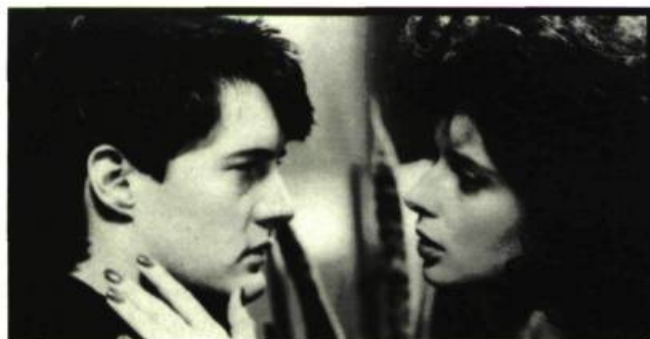
Blue Velvet , un des films analysés au séminaire de Michel Chion

— Nous sommes au service de la communauté du cinéma. Cette année, nous allons mettre en vedette les produits dans lesquels nous avons investi. On aura dans les chaînes de cinéma une annonce signalant la qualité des produits de cinéma canadiens. Téléfilm Canada , ça n'existe pas sans les produits des créateurs ●