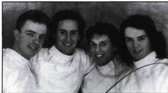
Les «mousquetaires» de Tous pour un, un pour tous

En réalisant Tous pour un, un pour tous , Diane Létourneau se trouvait à son tour à la merci du destin, car bien malin celui qui aurait pu prévoir comment allait se solder l'aventure des quatre «mousquetaires» qu'elle a voulu suivre jusqu'aux Jeux Olympiques de Barcelone. De fait, un seul y parviendra, sans toutefois remporter l'ultime consécration. Si Létourneau n'escamote pas les moments difficiles vécus par les jeunes escrimeurs face à la défaite, il se dégage tout de même de l'ensemble une impression de bonheur, d'optimisme indéfectible. Cette approche positiviste est bien servie par la personnalité de chacun des escrimeurs, qui ne manquent pas de dynamisme.