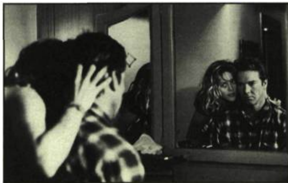
Meg Ryan et Dennis Quaid dans Flesh and Bone

complètement dénuées de couleurs. Ce faux noir et blanc confère aux images une beauté et une étrangeté qui ne vont sans rappeler l'univers de Tim Burton dans Batman et Tim Burton's the Nightmare Before Christmas . D'ailleurs mon petit doigt me dit que l'influence de Burton ne fait que commencer à se faire sentir dans le cinéma américain. Addams Family Values n'est quand même pas juste un