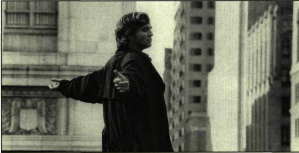
Jeff Bridges dans Fearless