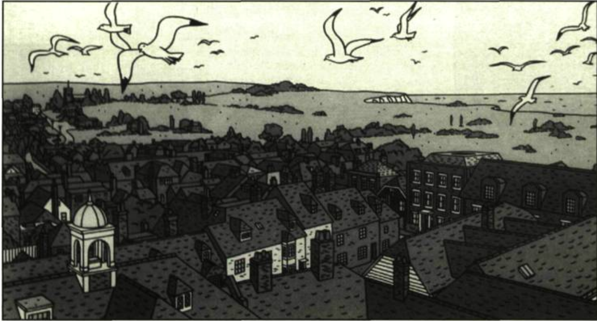
Le village de Hutton Buscel dessiné par Floc'h