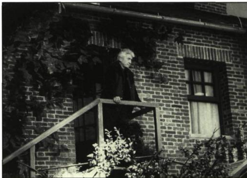
Alain Resnais sur le plateau de tournage

choix. Il y a toujours un petit moment où l'on se dit : non, non celui-là, je ne le ferai pas. Mais pour Intimate Exchanges , cela s'est passé d'une manière un peu diverse. J'avais remarqué que, dans les 47 pièces d'Ayckbourn (à ce moment-là, il en avait 43), il y avait une pièce très spéciale écrite en 1982 et qui, contrairement aux autres, n'était pratiquement jamais jouée. Ayckbourn est traduit dans un grand nombre de pays du monde. Mais, même en Angleterre, Intimate Exchanges a été moins jouée que les autres, car pour la