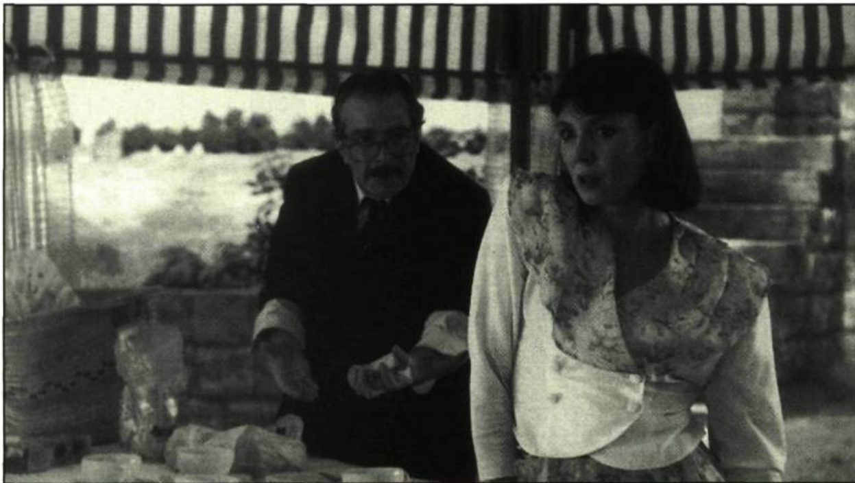
Toby et Celia dans Smoking

— Avec beaucoup de scrupule. Comme ce sont des acteurs que je connaissais très bien — parce que nous avons déjà travaillé ensemble —, je ne voulais pas que ce soit par facilité. Ce sont eux les premiers qui me sont venus en tête. Ils avaient la supériorité sur d'autres acteurs français d'avoir une connaissance d'Ayckbourn, ce qui était assez rare. Sabine Azéma avait vu une dizaine des pièces d'Ayckbourn en Angleterre. Et Pierre Arditi avait joué une pièce d'Ayckbourn. D'autre part, Arditi est venu en Angleterre, il a parlé avec Ayckbourn. Bref, ce choix était raisonné. Il y avait vraiment quelque chose chez eux qui inspirait confiance dans la possibilité de jouer tous les personnages, sans faire des transformations profondes, parce qu'il fallait qu'on les reconnaisse. Si vous me parlez des hésitations : est-ce qu'on fait des maquillages extraordinairement