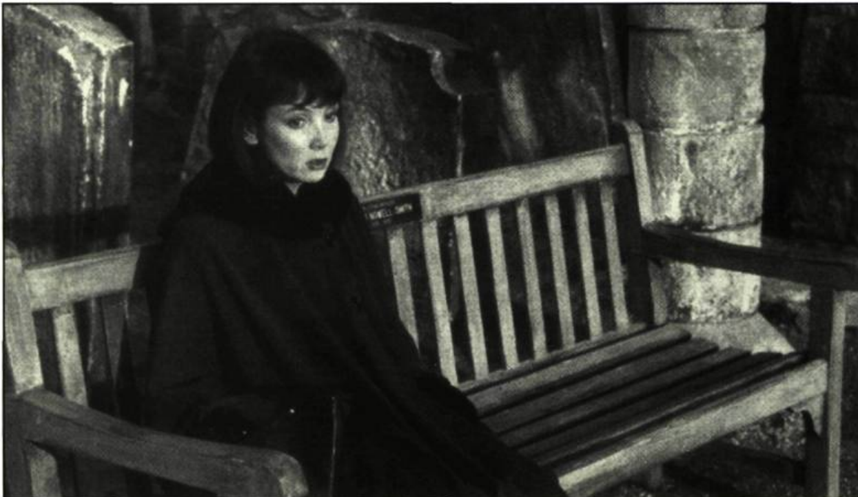
Celia dans Smoking

— Certainement. Il y avait des moments où l'acteur et l'actrice changeaient de personnages trois fois dans la journée. Il fallait alors compter une heure d'arrêt.