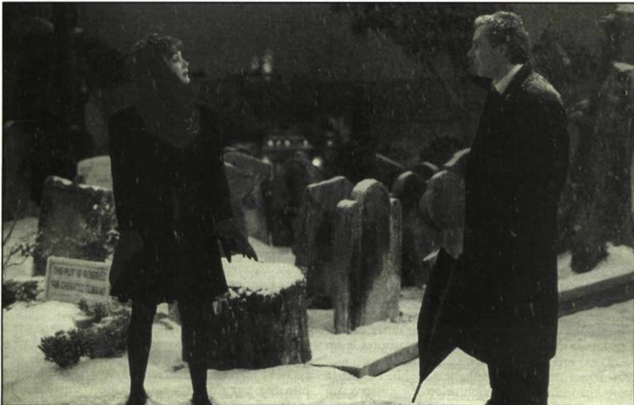
Rowena et Miles dans No Smoking