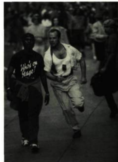
Die Hard with a Vengeance de John McTiernan