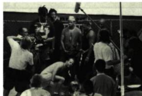
Tournage de Die Hard with a Vengeance