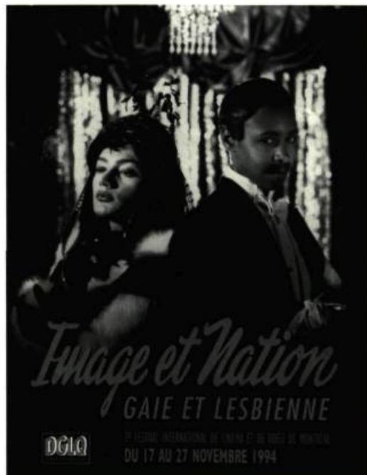
IMAGE ET NATION GAIE ET LESBIENNE

Photographe de plage, puis opérateur d'actualité, le Britannique G.A. Smith devient vite l'un des pionniers dans l'utilisation de la surimpression. Son goût des gros plans le mène à se créer un style considéré révolutionnaire pour l'époque. Dans Grandma's Reading Glass , une grand-mère et son petit-fils apparaissent d'abord en plan américain. Puis, le garçonnet s'empare de la loupe et l'on voit successivement dans un cache circulaire sur l'écran une montre, un canari, l'œil de la grand-mère, la tête du chat, etc.