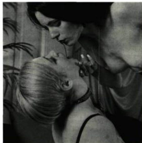
The Elegant Spanking

Ce qui surprend d'emblée, au visionnement de ces courts métrages sexant l'imaginaire lesbien, c'est la variété des approches stylistiques, la variété des discours aussi, et du ton des présentations. Dans le programme Punkilingus , c'est la passion et la violence,