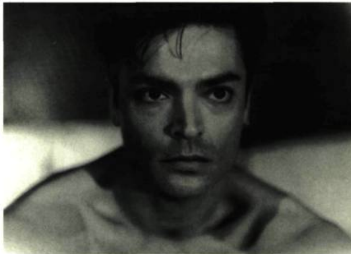
To Die For

On ne peut qu'approuver la bonne initiative qu'ont eue les programmeurs du festival de regrouper les films par thématiques. Si la septième édition d' Image et Nation s'est révélée copieuse vu le nombre impressionnant de films et de vidéos présentés, il n'en demeure pas moins qu'à l'exception de quelques erreurs de programmation (en particulier en ce qui concerne certains courts métrages inscrits dans Public Sex et Pornorama ), le cru 94 s'est avéré un des plus intéressants depuis les débuts de cette manifestation. On peut toutefois regretter que le regard des cinéastes gays posé sur leur culture manque parfois d'auto-critique.