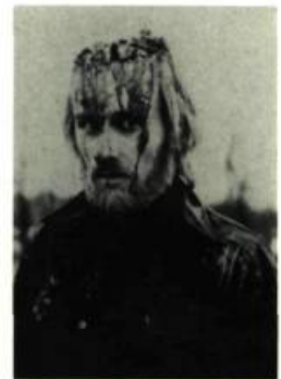
Dawn of the Dead