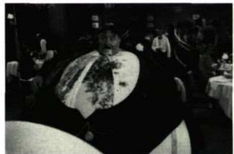
La grande bouffe de The Meaning of Life