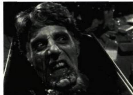
Un médecin qui perd la tête dans Re-Animator

Dans ce film, l'humour résulte de la tension nerveuse que provoque l'horreur. Evil Dead 2 , qui est plus un remake qu'une suite, ne se préoccupe plus de récit et de suspense. Le premier zombi y apparaît cinq minutes après le générique et c'est l'enfer (littéralement!) pour les 80 autres minutes qui se déroulent dans un climat d'hystérie, un rythme et un ton