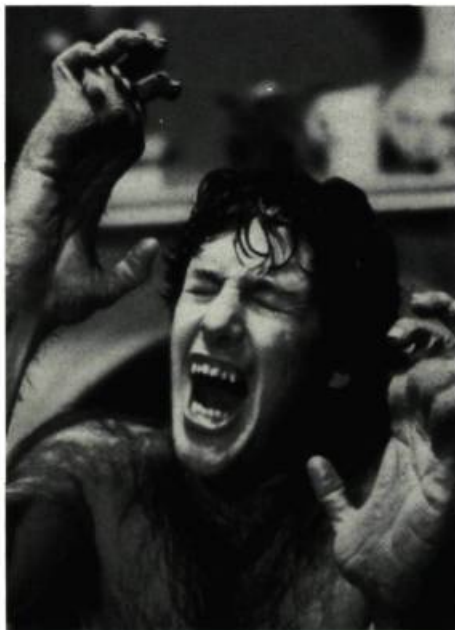
... et celui de An American Werewolf in London

Jackson prétend d'ailleurs que Braindead , un des films les plus sanguinolents jamais faits, est sorti sans problème dans des pays aussi stricts que l'Angleterre et l'Australie, tandis que Henry: Portrait of a Serial Killer , un film beaucoup moins violent mais dépourvu d'humour, a dû faire face à de nombreux problèmes de censure dans bien des pays.