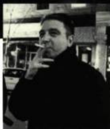
Quand l'amour est gai