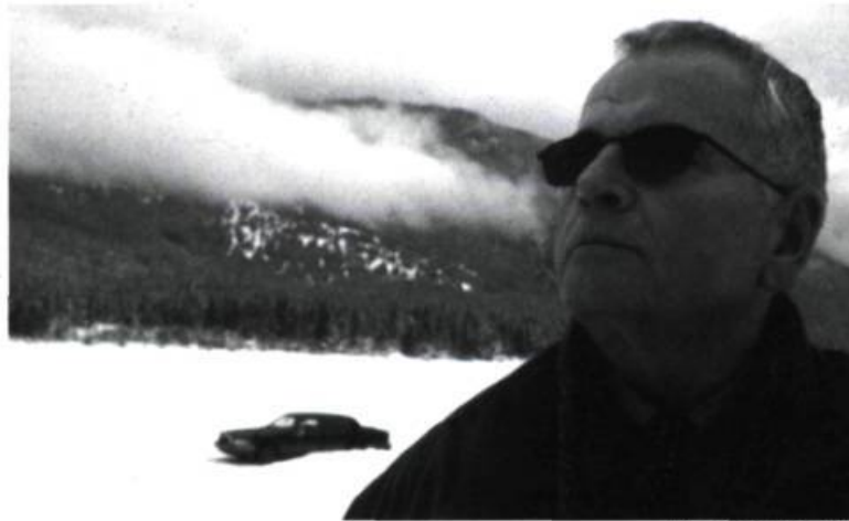
The Sweet Hereafter

Je suis très influencé par des films où je ne sais trop ce que je suis en train de voir. J'ai vu tout récemment pour la première fois des films de Satyajit Ray. Je ne peux exprimer à quel point ils m'ont marqué. Ironiquement, je ne sais pas ce que la critique en a dit à leur sortie, ni quel succès financier ils ont remporté. J'ai été particulièrement impressionné par Pather Panchali : j'ai peine à croire que je me suis retrouvé dans cette petite maison d'un