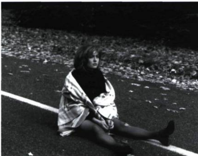
You Are Here

La route est beaucoup plus présente et le transit plus troublant dans Shady Grove , une autre première œuvre, de l'Américain Christian Moore. Ce projet, d'abord un court métrage étudiant, s'est transformé en long grâce à l'intérêt d'un producteur. D'un coin perdu du Texas, Shady Grove, à la jungle de New York, le film raconte le cheminement initiatique de Zak, un jeune chanteur mélancolique sans grand talent ni conviction, qui suit sa